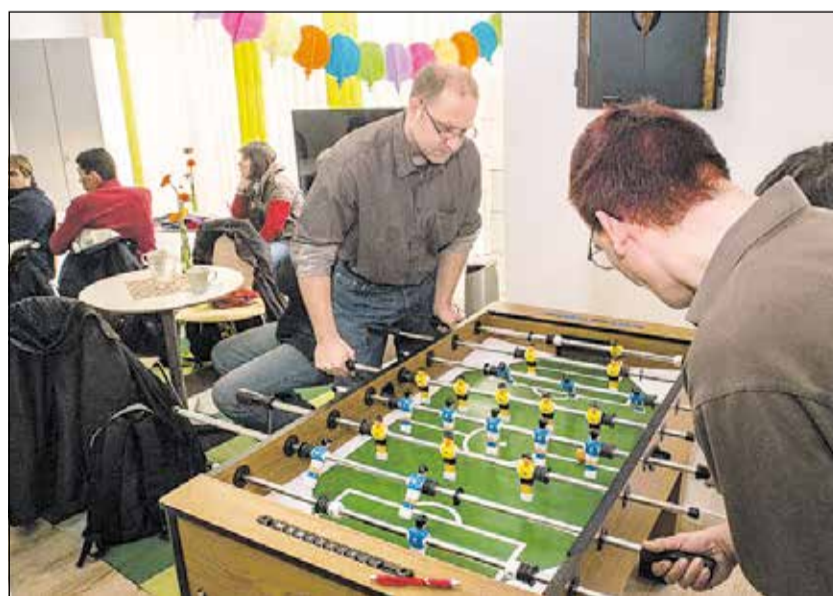
Der „Luisentreff“ lädt zum Kickern ein.

Jeweils montags von 17 bis 19.30 Uhr findet an der Luisenstraße 30 in den ehemaligen Räumlichkeiten von Zweirad Müller ein „offener Treff“ statt. Am Freitag ist sogar von 13.30 bis 19.30 Uhr geöffnet – dann werden ab 15 Uhr immer im Wechsel Dart- oder Kickerturniere sowie Bingo- oder Karaoke-Nachmittage veranstaltet. Neben dem sportlichen