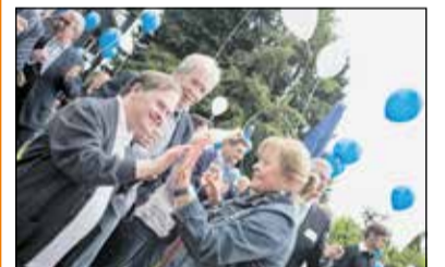
Die Lebenshilfe lädt wieder zum Sommerfest an die Heidestraße.

Spiel, Spaß und natürlich jede Menge gute Laune sind garantiert, wenn im Lebenshilfe-Stammsitz an der Heidestraße in Wuppertal-Cronenberg am Samstag, 13. Juni, das große Sommerfest steigt. Mitmach-Aktionen, Live-Musik und die Einweihung der sanierten Werkstätten sind geplant, namhafte Gäste werden hierzu natürlich wieder erwartet. Denn in diesem Jahr feiert die Lebenshilfe Wuppertal ihr 55-jähriges Bestehen. mm