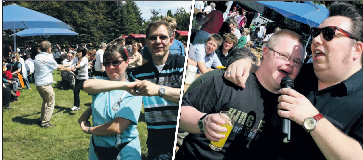
Ein geselliges Beisammensein und jede Menge Unterhaltung und Action bot das diesjährige Sommerfest wieder.