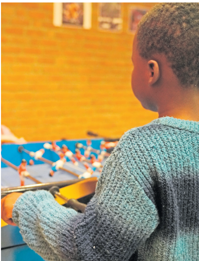
...und Freude beim Kickern.