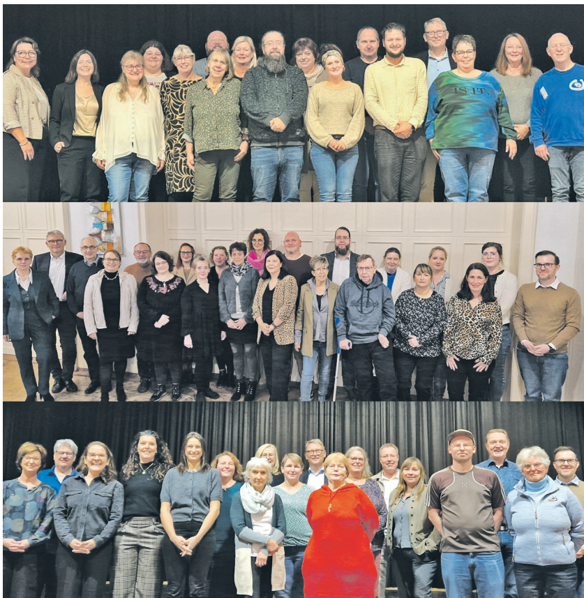
Geschäftsleitung, Vereinsvorstand und Menschen mit Unterstützungsbedarf sagen von Herzen „Danke“.

Aufgrund der großen Zahl an Geehrten fanden die Jubilarfeiern an drei Abenden im Seerosensaal in Nettetal-Lobberich statt. Und jeder dieser Abende war geprägt von Wertschätzung, persönlichen Geschichten und ehrlichen Emotionen. Im Mittelpunkt standen die Menschen hinter den Zahlen: Männer, die einst über den Zivildienst zur Lebenshilfe fanden. Quereinsteigerin-