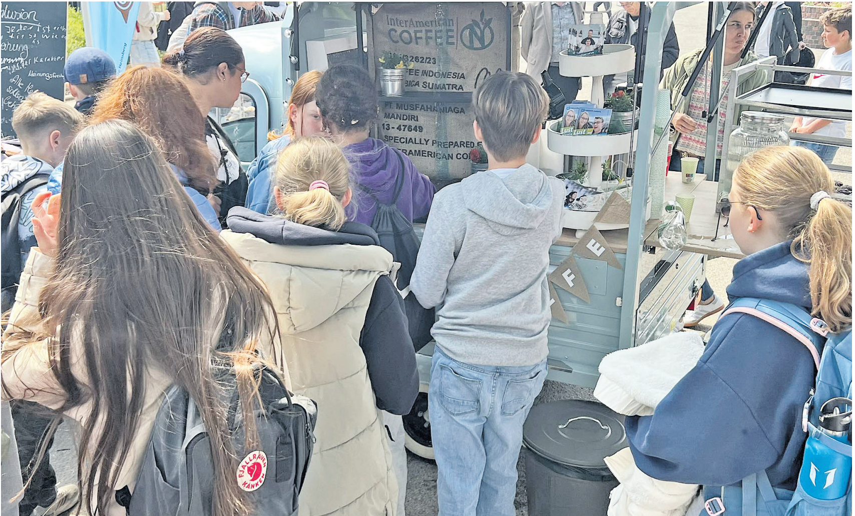
Unterwegs mit leckerem Kaffee: Die restaurierte APE bringt Menschen zusammen.

Ein wichtiger Schritt war die Umrüstung vom alten Benzinmotor auf einen umweltfreundlichen Elektroantrieb. Mit Unterstützung der Kreissparkasse Heinsberg erhielt das Fahr-