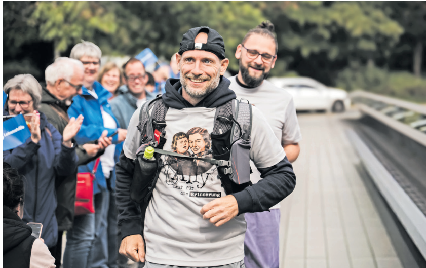
Überglücklich kurz vor dem Ziel

♥ Inzwischen wurden 50.000 Euro an Spenden erreicht! 250.000 Euro sind das Ziel. Alle Infos unter: www.ally-der-film.de