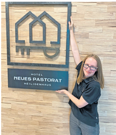
Ihr neuer Arbeitsplatz.

durch ihr Praktikum, auch wenn ihre Seheinschränkung manchmal eine Herausforderung ist. „Es ist gut, dass immer jemand kontrolliert, ob alles sauber ist“, sagt sie. „Vielfalt durch Inklusion“ heißt es in der Philosophie des Stadthotels. Das zeigt sich nicht nur durch barrierefreie Räumlichkeiten, sondern auch in der Mitarbeiterschaft.