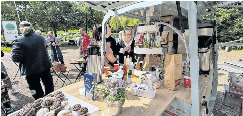
Muffins, verschiedene Kaffeesorten und andere Köstlichkeiten werden angeboten.

zeug nicht nur einen Elektromotor, sondern auch einen leistungsstarken Akku, der einen ganzen Einsatztag die Kaffeezubereitung ermöglicht und den Einsatz sowohl draußen als auch in Innenräumen, etwa bei Ausstellungen, Veranstaltungen oder Aktionstagen erlaubt.