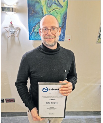
Stolz und glücklich über die Auszeichnung.