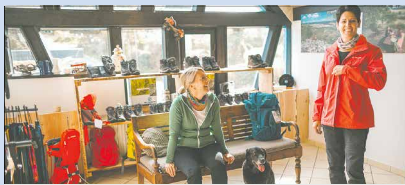
Testcenter für Wanderer: Moderne Ausrüstung kostenfrei ausleihen.

Die Teilnehmerin/der Teilnehmer kann seine erklärte Einwilligung jederzeit widerrufen. Der Widerruf ist schriftlich an die im Impressum angegebenen Kontaktdaten des Veranstalters zu richten. Nach Widerruf der Einwilligung werden die erhobenen und gespeicherten personenbezogenen Daten des Teilnehmers umgehend gelöscht. Fragen oder Beanstandungen im Zusammenhang mit dem Gewinnspiel sind an den Betreiber zu richten. Der Rechtsweg ist im Hinblick auf die Ziehung der Gewinnerin/des Gewinners ausgeschlossen.