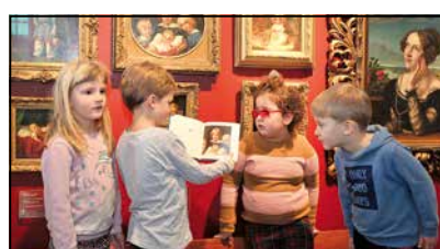
Die Kinder freuen sich über das neue Buch.

waschen“ mit Arbeiten aus dem Museum Begas-Haus in Heinsberg abgebildet werden.