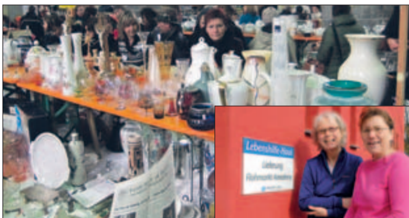
Trubel auf dem Flohmarkt in Aachen.

Voraussetzung für alle drei Dienste ist das Interesse am Einsatzgebiet im sozialen Bereich und der Begleitung und Unterstützung von Menschen mit Behinderung. Im Gegenzug erhalten die Engagierten eine Vergütung sowie eine gute praktische und theoretische Qualifizierung und Begleitung durch Fachkräfte – und zahlreiche positive Erfahrungen und persönliche Entwicklungen. Weitere Infos unter www.mein-lebenshilfe-jahr.de