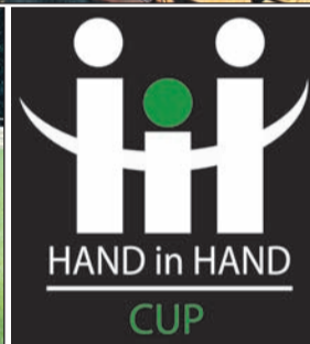
Foto oben: die Pokalübergabe, das Siegerteam aus Düsseldorf nach dem „Elfmeter-Krimi“, Logo des Hand-in-Hand-Cup (re.).