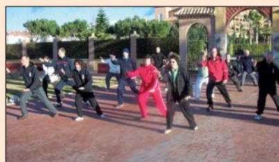
Schüler des Tai Chi Forums beim Ferienkurs an der Torrox Costa in Andalusien/Spainien.

Langsam geht eine Bewegung in die nächste über. Konzentriert werden die Übungen beim Tai-Chi-Chuan, einer jahrhundertealten, chinesischen Bewegungstechnik mit meditativer Ausrichtung, ausgeführt. Im Tai-Chi-Chuan als Entspannungstraining kommt es auf Weichheit und Geschmeidigkeit an. Die Muskulatur soll im Laufe der Zeit entspannt und die Gelen-