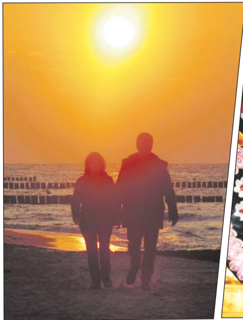
Wenn die Herzen im Frühling höher schlagen.

Eine Flasche Wein mit persönlichem Etikett: aus einem Spitzenwein eine eigene Marke kreieren, beispielsweise mit einem Foto von