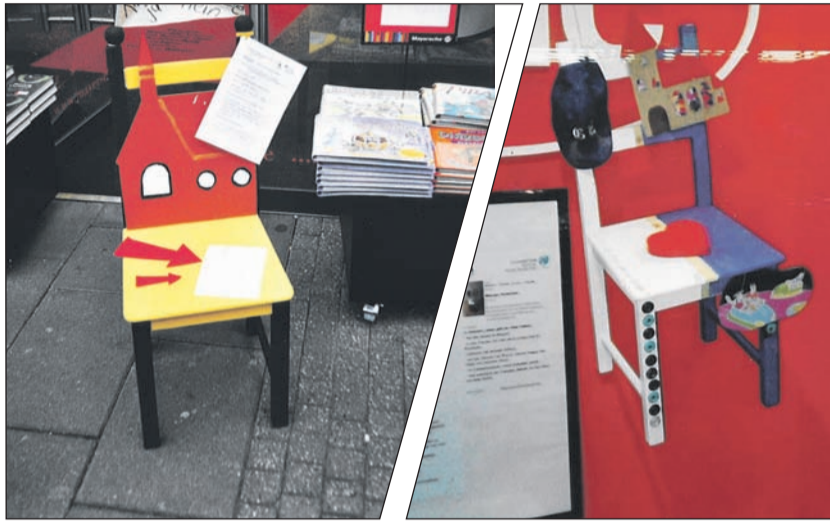
Tolle Aktion in Viersen unter dem Motto „Kommt und seht“.

Die 35 sehr unterschiedlich, geschmackvoll und kunstvoll gestalteten Stühle, darunter auch fünf von Bewohnern verschiedener Wohnstätten der Lebenshilfe Viersen in