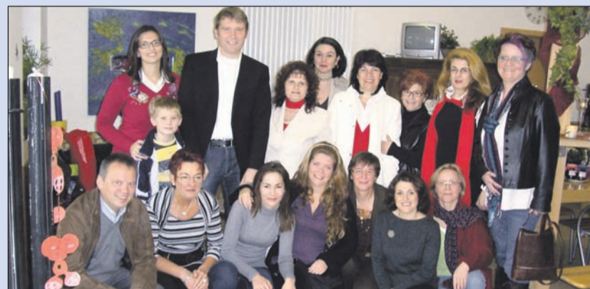
Erfahrungsaustausch in verschiedenen Sprachen.

Die Mitarbeiter der Lebenshilfe in Griechenland interessieren sich, mehr darüber zu erfahren, wie die staatliche Unterstützung funktioniert und welche Erfahrungen in Deutschland mit den unterschiedlichen Formen der Unterstützung gemacht werden. Denn in Griechenland ist die Lebenshilfe ausschließlich privat finanziert. Ist in Griechenland ein Mensch geistig behindert, bleibt – wenn er keine Familie hat, die ihn aufnimmt – oft nur die Psychiatrie. Die Woche in Deutschland