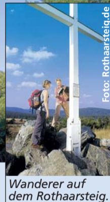
Wanderer auf dem Rothaarsteig.

nus ebenso wie an den steilen Talhängen des Rheintals. Beliebter Einstieg bei Wanderern: im Rheingau, denn hier verläuft der Weg nicht durch Schluchten, sondern über sanfte Hügel und Rebhänge mit tollem Panoramablick ins Rheintal.