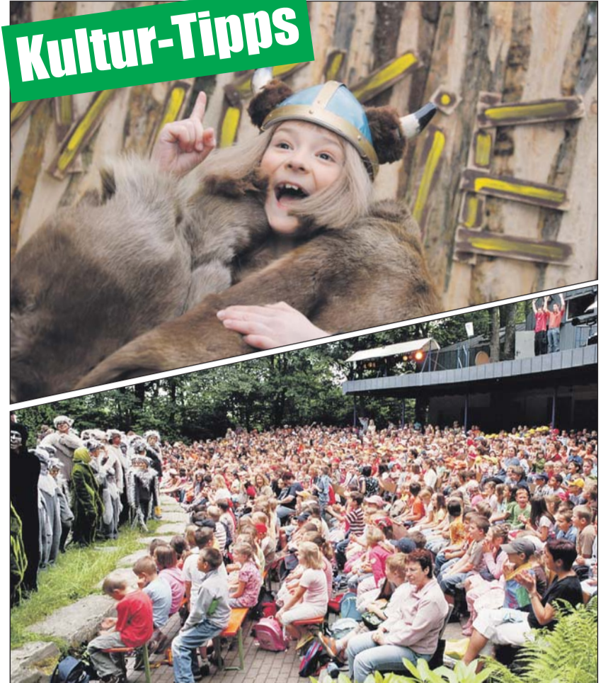
Abwechslungsreiches Programm wird auf der Waldbühne Heessen in Hamm und auf der Freilichtbühne Schloß Neuhaus geboten.