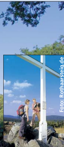
Wanderer auf dem Rothaarsteig.

nus ebenso wie an den steilen Talhängen des Rheintals. Beliebter Einstieg bei Wanderern: im Rheingau, denn hier verläuft der Weg nicht durch Schluchten, sondern über sanfte Hügel und Rebhänge mit tollem Panoramablick ins Rheintal.