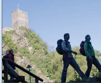
Wanderer auf dem Eifelsteig vor dem Kloster Himmerod in Manderscheid.