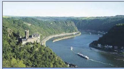
Tolle Aussicht auf die Burg Katz und die Loreley.

Natur ist Trumpf entlang des Rheinsteigs, an den Höhen von Siebengebirge, Westerwald und Tau-