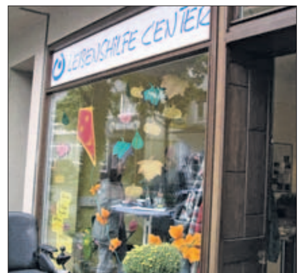
Lebenshilfe Center Hamm

Zurzeit gibt es neben dem Lebenshilfe Center in Hamm auch Center in Olpe, Netphen/Siegen, Gelsenkirchen, Gladbeck, Arnsberg und Duisburg. Weitere acht Center sind geplant. Infos im Internet unter www.lebenshilfe-nrw.de/einrichtungen suche