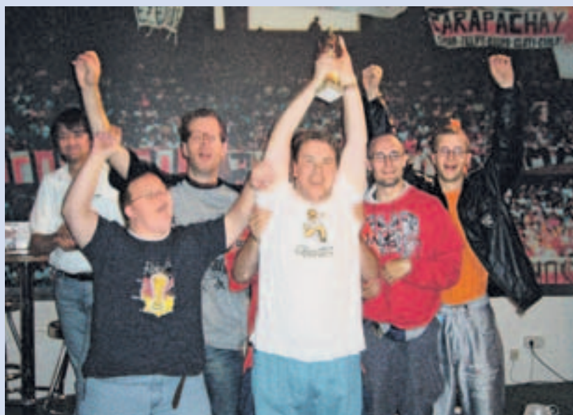
Freuen sich wie die Sieger: Der dritte Platz ging beim ersten Turnier 2007 an die Mannschaft der Werkstatt Alpen-Veen.

Ja, und so ein Projekt ist eben auch das alljährliche Fußballturnier mit unseren Mitarbeitern. Es werden immer zwei Mannschaften gebildet, eine aus der Werkstatt in Alpen-Veen und eine aus der Werkstatt in Rees. Diese treten gegen die beiden Mannschaften von Round Table und Old Table – eine Schwesterorganisation – an, jeder spielt gegen jeden. Man muss al-