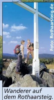
Wanderer auf dem Rothaarsteig.

nen ebenso wie an den steilen Talhängen des Rheintals. Beliebter Einstieg bei Wanderern: im Rheingau, denn hier verläuft der Weg nicht durch Schluchten, sondern über sanfte Hügel und Rebhänge mit tollem Panoramablick ins Rheintal.