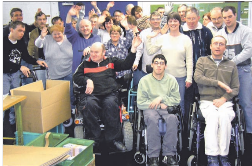
Die Gruppe 1050 aus der Solinger Werkstatt für Menschen mit Behinderung

Im Jahr 1958, dem Gründungsjahr der Bundesvereinigung der Lebenshilfe, war die Integration behinderter Menschen noch keine Selbstverständlichkeit. In einer behindertenfeindlichen Gesellschaft, in der sich staatliche Stellen nicht zuständig für die Sorgen und Belange der betroffenen Eltern fühlten, blieb diesen nur die Selbstorganisation. Umso notwendiger war es daher auch auf kommunaler Ebene eine Anlaufstelle für die Betroffenen und ihre Angehörigen anzubieten. Als eine der ersten Ortsvereinigungen wurde die Lebenshilfe in