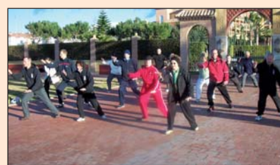
Schüler des Tai Chi Forums beim Ferienkurs an der Torrox Costa in Andalusien/Spainien.

Langsam geht eine Bewegung in die nächste über. Konzentriert werden die Übungen beim Tai-Chi-Chuan, einer jahrhundertealten, chinesischen Bewegungstechnik mit meditativer Ausrichtung, ausgeführt. Im Tai-Chi-Chuan als Entspannungstraining kommt es auf Weichheit und Geschmeidigkeit an. Die Muskulatur soll im Laufe der Zeit entspannt und die Gelen-