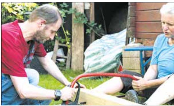
Im Einsatz für das Tierheim

Sicherlich nichts außergewöhnliches, dass es Menschen gibt, die hier mit anpacken – doch in diesem Falle schon: Die Männer und Frauen sind Menschen mit einer geistigen Behinderung. Sie brauchen Begleitung und Unterstützung bei der Bewältigung ihres Alltags. Der eine mehr, der andere weniger. Diese Unterstützung erhalten sie von Mitarbeitern und Mitarbeiterinnen des Lebenshilfe Centers Siegen.