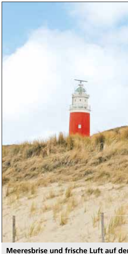
Meeresbrise und frische Luft auf der Insel Texel genießen.

Damit Kinder mit und ohne Behinderung ihre Ferien gemeinsam verbringen können, bietet die Feri-