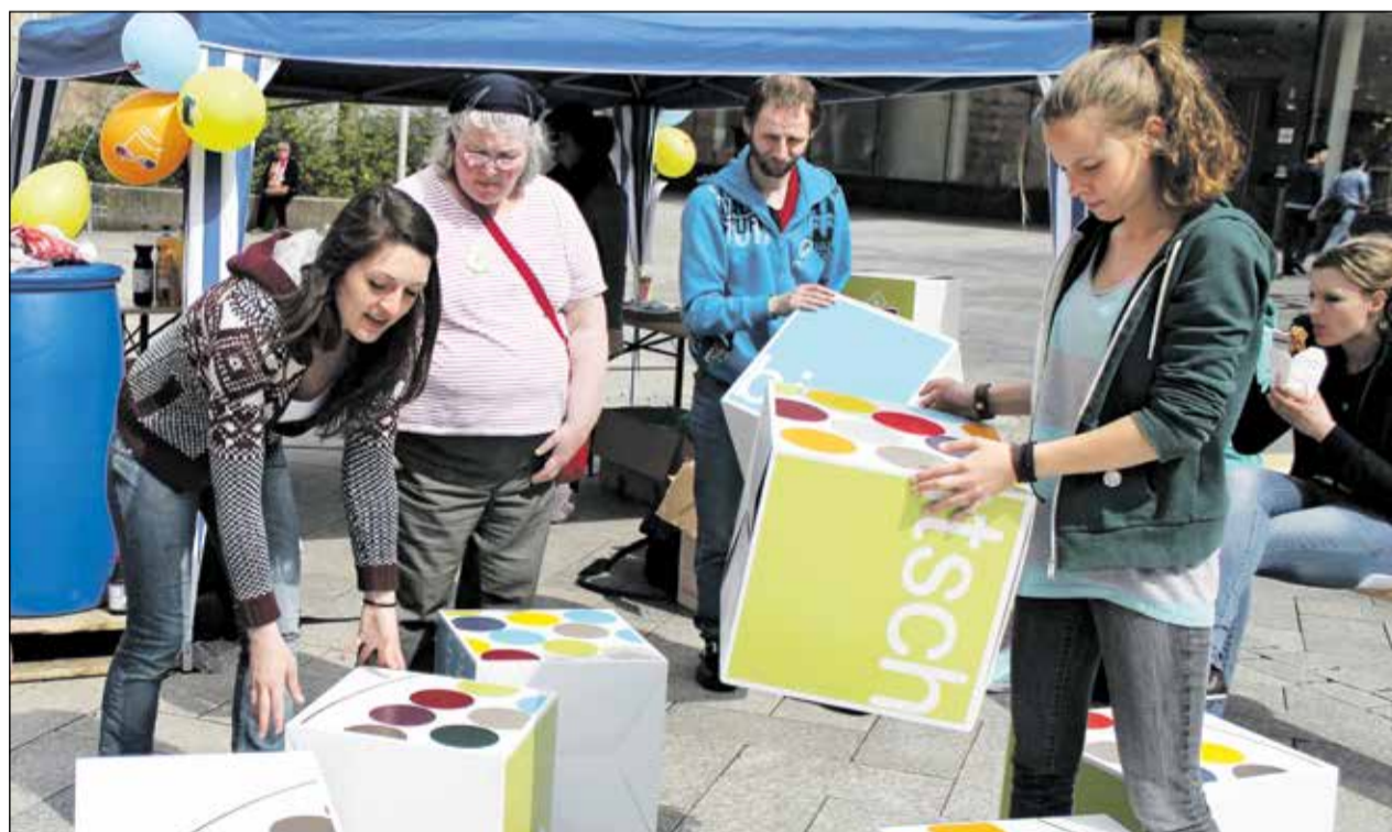
Das Lebenshilfe Center Siegen plant auch dieses Jahr einen Aktionstag.

statt übereinander reden, Unsicherheiten im Umgang mit dem Anderen verlieren und Vorurteile beseitigen, das ist das Ziel des Aktionstages in diesem Jahr. Kämpflein