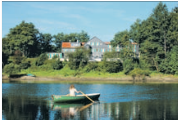
Erlebniswelt Haus Hammerstein im Bergischen Land.

wendigen Ausrüstung auch zusätzliche Serviceleistungen an: Dazu gehören der Gepäcktransfer und fachkundige Tourenbegleitungen. Damit sich auch Kanuten mit Handicap aufs Wasser wagen können, gibt es spezielle Angebote für Geh-