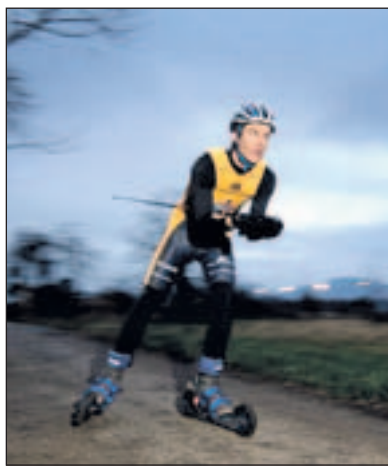
Mit einem guten Armschwung geht es schnell voran.