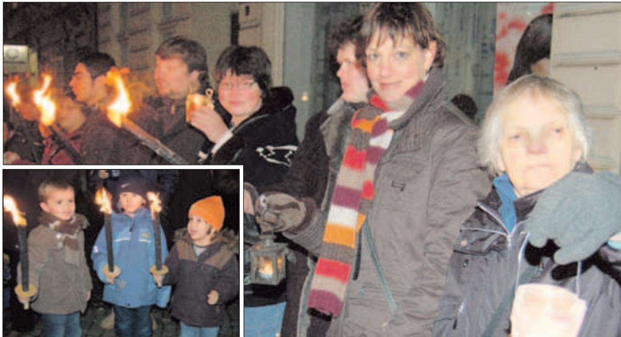
Mitarbeiter der Werkstatt Lebenshilfe hielten mit Begeisterung Fackeln und Laternen. Für die Kinder war die Stadtwette ein großer Spaß.