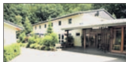
Haus Bröltal erhält im Frühjahr 2009 einen neuen Wintermantel und „Sonnenergie“ für einen besseren Schutz der Umwelt.

Bereits 2007 waren sich sämtliche Mitarbeiter des Hauses Bröltal in Ruppichterath einig, dass vor allem das einheimische Publikum zukünftig mehr über das Haus und seine Aufgaben erfahren sollte. Die geplanten Aktionen sollten zur „Entmystifizierung“ des Hauses beitragen, denn in Dorf und Umgebung war oft die Rede von: „Da oben am Berg wohnen die Behinderten!“ Die verschiedensten Aktionen wurden geplant, u. a. der vierteljährliche Familienbrunch mit Kinderbetreuung. Die wohl erfolgreichste Aktion aber war der Tag der offenen Tür im Frühjahr. Trotz des Aprilwetters besuchten über 500 Gäste das Haus der Lebenshilfe NRW. Ein wunderbarer Tag, an dem Begegnung von Menschen mit unterschiedlichsten Stärken und Schwächen möglich wurde. Der Tag danach wird allen