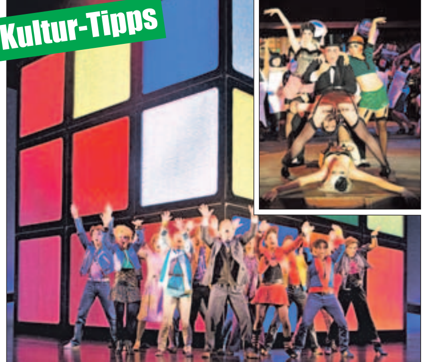
Reise in den Berliner Kit-Kat-Club der 20er-Jahre und in die Aufbruchstimmung der 80er.

Ich will Spaß! Das 80er Hit Musical mit den Hits der Neuen Deutschen Welle nimmt die Zuschauer im Colosseum-Theater in Essen mit auf eine Achterbahnfahrt der Gefühle. Eine Geschichte über Familie, Rebellion und wahre Liebe: aufregend und witzig, leise und nachdenklich, launisch und wild. Die Charaktere bewegt, was unsere Gesellschaft in den 80er-Jahren geprägt hat und heute noch beschäftigt: Friedensaktivismus, Generationskonflikte, veränderte Rollen von Mann und Frau. Die Suche nach der großen Liebe und dem eigenen Platz im Leben. Jeder will seine Träume verwirklichen, unabhängig sein – und Spaß haben. Tickets und Infos gibt es unter (0 18 05) 44 44 oder www.musicals.de