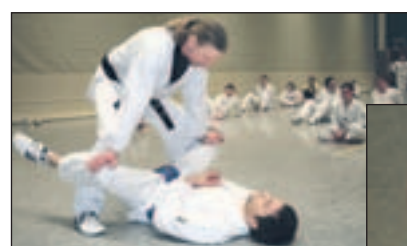
Beim Training

Das Wort setzt sich aus „Tae“ (Fuß), „Kwon“ (Faust) und „Do“ (geistiger Weg) zusammen: „Es ist mehr als körperliches Training. Die Ausbildung umfasst die Schulung von Körper und Geist. Im Taekwondo lernst du deinen größten Gegner kennen – dich selbst. Du lernst, deinen Körper und deine Kraft wahrzunehmen. Du entdeckst deine Grenzen und machst dich auf den Weg, diese zu überwinden“, sagt