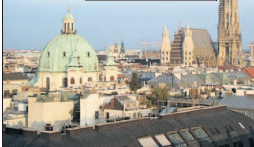
Neben süßen Köstlichkeiten (Palatschinken, Foto: Maren Bebler©PIXELIO) bietet Wien tolle Sehenswürdigkeiten wie den Stephansdom (Foto: Schmidinger©PIXELIO).

unsere nächste Station. Ein prächtiger Saal, der von endlos lang erscheinenden Marmorsäulen getragen wird. Der Ober serviert Heidelbeer-Palatschinken mit einer Kugel Vanilleeis und eine „Wiener Melange“, ein stark mit aufgeschäumter Milch versetzter, mit einem Häubchen Schlagobers bekrönter und einer Prise Zimt oder Kakao bestäubter Kaffee, und eine „Große Schwarze“ (Mokka).