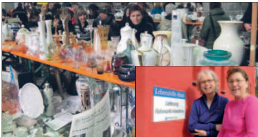
Trubel auf dem Flohmarkt in Aachen.

Voraussetzung für alle drei Dienste ist das Interesse am Einsatzgebiet im sozialen Bereich und der Begleitung und Unterstützung von Menschen mit Behinderung. Im Gegenzug erhalten die Engagierten eine Vergütung sowie eine gute praktische und theoretische Qualifizierung und Begleitung durch Fachkräfte – und zahlreiche positive Erfahrungen und persönliche Entwicklungen. Weitere Infos unter www.mein-lebenshilfe-jahr.de