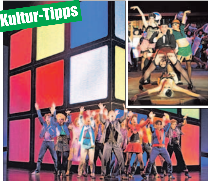
Reise in den Berliner Kit-Kat-Club der 20er-Jahre und in die Aufbruchstimmung der 80er.

Ich will Spaß! Das 80er Hit Musical mit den Hits der Neuen Deutschen Welle nimmt die Zuschauer im Colosseum-Theater in Essen mit auf eine Achterbahnfahrt der Gefühle. Eine Geschichte über Familie, Rebellion und wahre Liebe: aufregend und witzig, leise und nachdenklich, launisch und wild. Die Charaktere bewegt, was unsere Gesellschaft in den 80er-Jahren geprägt hat und heute noch beschäftigt: Friedensaktivismus, Generationskonflikte, veränderte Rollen von Mann und Frau. Die Suche nach der großen Liebe und dem eigenen Platz im Leben. Jeder will seine Träume verwirklichen, unabhängig sein – und Spaß haben. Tickets und Infos gibt es unter (0 18 05) 44 44 oder www.musicals.de