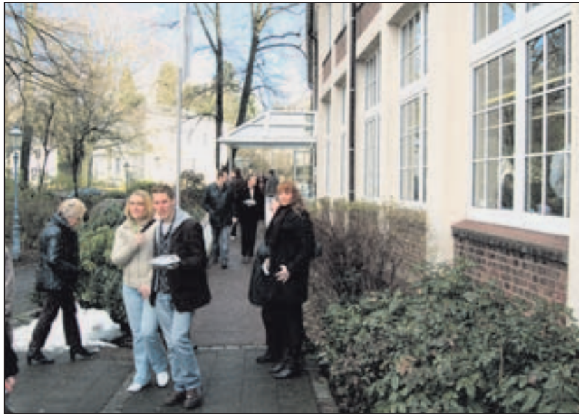
Die Tür zur Werkstatt der Lebenshilfe steht interessierten Besuchern immer offen, nicht nur zum Weihnachtsmarkt oder anderen öffentlichen Veranstaltungen.