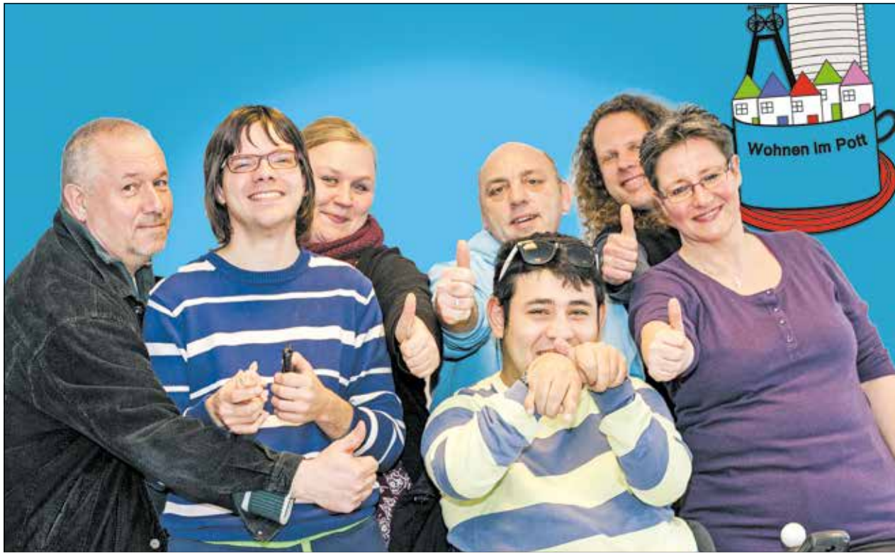
Das Team von „Wohnen im Pott“ kümmert sich unter anderem um die Wohnungsvermittlung von Menschen mit Behinderung in Oberhausen.

Projekt der Lebenshilfe Oberhausen berät Menschen mit Behinderung bei der Wohnungssuche / Auszeichnung mit Inklusionspreis NRW