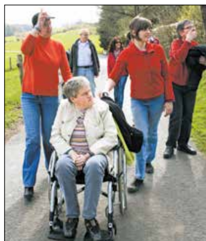
Bewohner des Haus Lebenshilfe in Wenden mittendrin – hier bei der Wanderung am 1. Mai.

Um den eigenen Sozialraum im Alter zu erfahren und zu pflegen, haben Menschen mit Behinderung, die in der Wohnstätte Wenden leben, sowie externe Teilnehmer