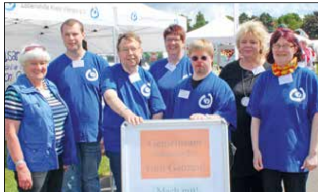
Zahlreiche Mitmach-Aktionen an den Ständen der Lebenshilfe Oberhausen (o. l./Karaoke), der Lebenshilfe Kreis Viersen (o. r./Malen) und der Lebenshilfe NRW (u. l./eine Form des Malens). Der Lebenshilfe Rat Kreis Viersen war auch dabei (u. r.).