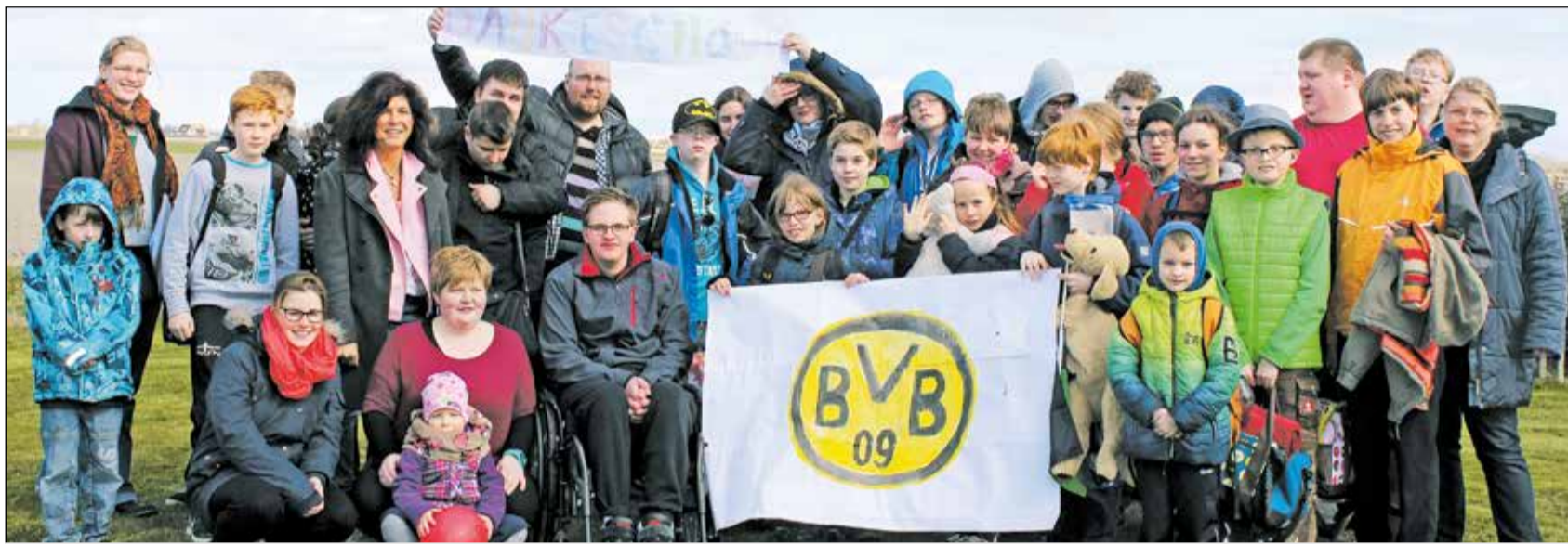
Dankeschön BVB: Kinder mit und ohne Behinderung hatten eine erlebnisreiche, gemeinsame Zeit auf Texel.

Kinder mit und ohne Behinderung begeistert / BVB-Stiftung fördert inklusives Ferien-Camp auf Texel