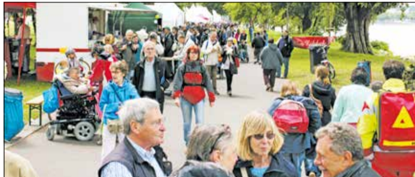
Viel los beim bunten und inklusiven Familienfest

„Wir alle möchten mit diesem bunten Fest zeigen, wie Inklusion funktionieren kann. Im Rheinland