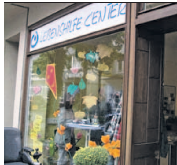
Lebenshilfe Center Hamm

Zurzeit gibt es neben dem Lebenshilfe Center in Hamm auch Center in Olpe, Netphen/Siegen, Gelsenkirchen, Gladbeck, Arnsberg und Duisburg. Weitere acht Center sind geplant. Infos im Internet unter www.lebenshilfe-nrw.de/einrichtungen suche