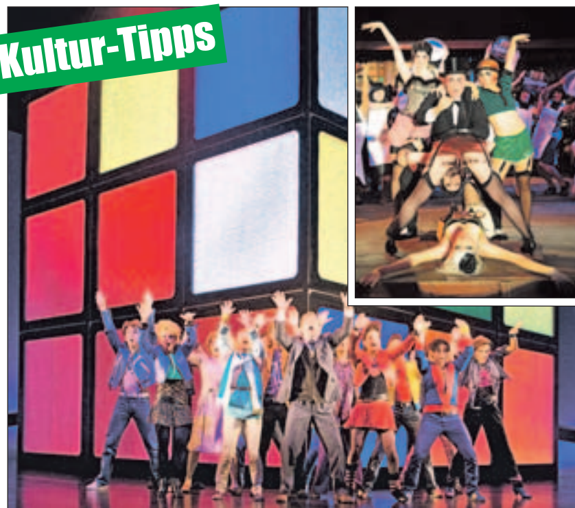
Reise in den Berliner Kit-Kat-Club der 20er-Jahre und in die Aufbruchstimmung der 80er.

Ich will Spaß! Das 80er Hit Musical mit den Hits der Neuen Deutschen Welle nimmt die Zuschauer im Colosseum-Theater in Essen mit auf eine Achterbahnfahrt der Gefühle. Eine Geschichte über Familie, Rebellion und wahre Liebe: aufregend und witzig, leise und nachdenklich, launisch und wild. Die Charaktere bewegt, was unsere Gesellschaft in den 80er-Jahren geprägt hat und heute noch beschäftigt: Friedensaktivismus, Generationskonflikte, veränderte Rollen von Mann und Frau. Die Suche nach der großen Liebe und dem eigenen Platz im Leben. Jeder will seine Träume verwirklichen, unabhängig sein – und Spaß haben. Tickets und Infos gibt es unter (0 18 05) 44 44 oder www.musicals.de