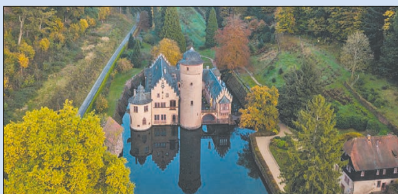
Wasserschloss Mespelbrunn

Gewinnen Sie zwei Übernachtungen mit Halbpension im Doppelzimmer im Wert von 350 Euro. Senden Sie uns eine E-Mail mit dem Betreff „Gewinnspiel Räuberland“ bis 15. Januar 2021 an gewinnspiel@lebenshilfe-nrw.de oder eine Karte/Brief per Post an Lebenshilfe NRW, Kennwort: „Gewinnspiel Räuberland“, Abtstraße 21, 50354 Hürth. Der Gewinner wird nach Ende des Einsendeschlusses unter allen Einsendungen gezogen und per Post informiert. Ausgeschlossen vom Gewinnspiel sind alle Mitarbeiter der Lebenshilfe NRW und der Orts- und Kreisvereinigungen. vv