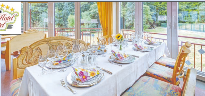
Genussvoll speisen im Wintergarten

Eine einzigartige Natur erwartet Sie im Räuberland, im Herzen des Spessarts mit einem der größten zusammenhängenden Mischwaldgebiete Deutschlands im Naturpark Spessart. Schon Kurt Tucholsky hat sich bei seinem Besuch über die herrliche Landschaft und das ein-