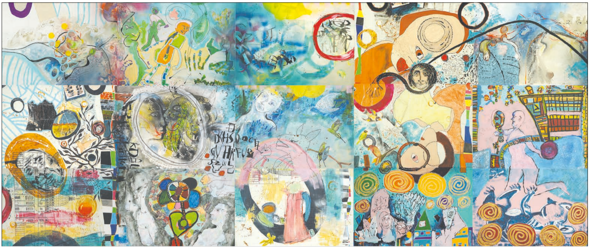
Das Gemeinschaftsbild „Kreuz und Quer“ besteht aus 15 einzelnen Platten, die wochenlang von Atelier zu Atelier wanderten und sich so ständig veränderten.