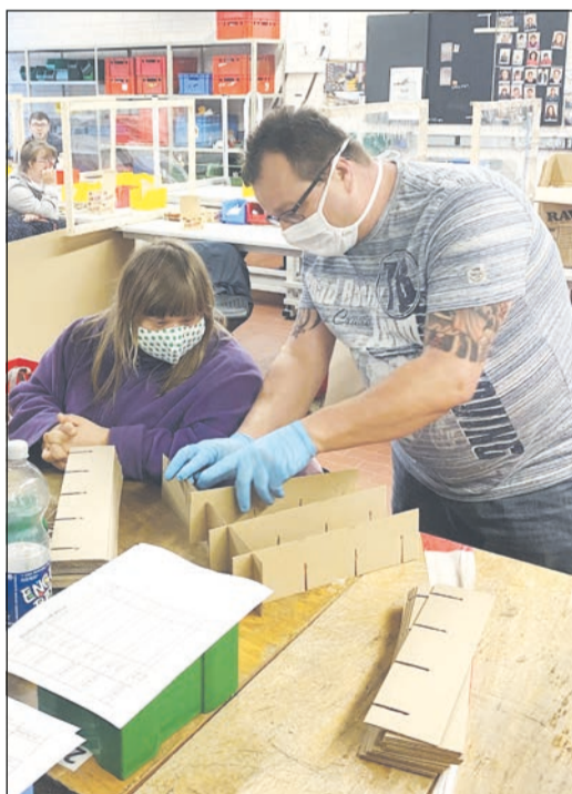
Arbeiten nach dem Schutzkonzept in der Werkstatt im Lipperfeld.