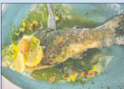
Spessartforelle aus eigenen Teichen, in Mandelbutter gebraten