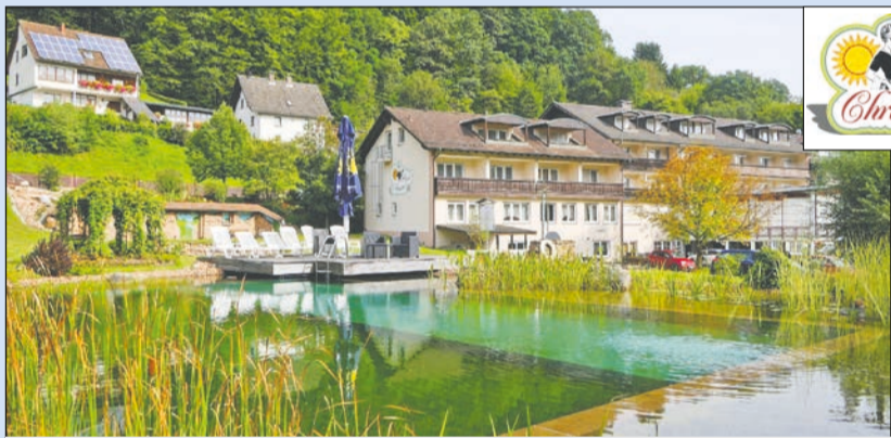
Das Drei-Sterne-Hotel Christel im Herzen des Spessarts

W andern in der schönen Qualitätsregion Wanderbares Deutschland Räuberland und übernachten bei einem Qualitätsgastgeber Wanderbares Deutschland. Das geht wunderbar im Räuberland! Wer allerdings nicht nur wandern, sondern die herrliche Natur und die Kultur genießen möchte, ist ebenfalls richtig.