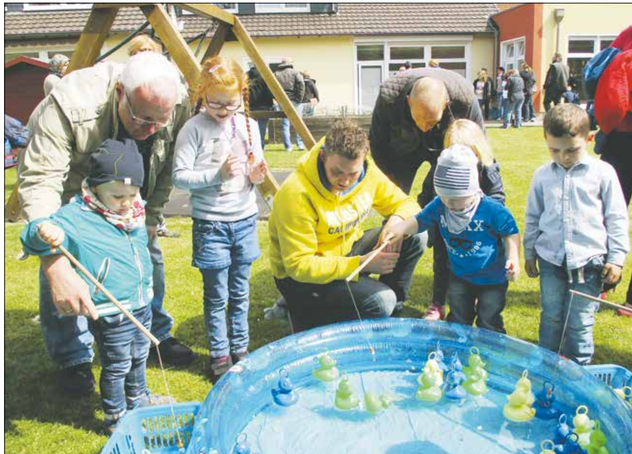
Volle Konzentration beim Enten-Angeln, das auf keinen Fall bei der Einweihungsfeier fehlen durfte