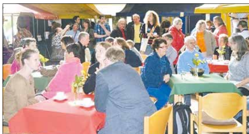
Viele Gäste kamen, um das interessante Thema aus vielen Blickwinkeln zu betrachten.

Einen der Höhepunkte bildete nun ein Palliativfachtage, der einen Einblick darin gab, dass das Leben nur geliehen ist und wie am Ende mit dieser Leihgabe, unserem Leben, würdig und gut umgegangen werden kann. In den Räumen der evangelischen Emmaus-Kirchengemeinde in Alstaden versammelten sich am 6. Mai zirka 150 Teilnehmenden, um sich informieren, ansprechen, inspirieren, anregen und berühren zu lassen.