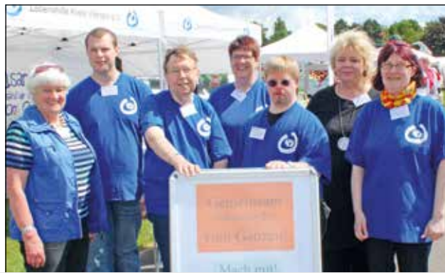
Zahlreiche Mitmach-Aktionen an den Ständen der Lebenshilfe Oberhausen (o. l./Karaoke), der Lebenshilfe Kreis Viersen (o. r./Malen) und der Lebenshilfe NRW (u. l./eine Form des Malens). Der Lebenshilfe Rat Kreis Viersen war auch dabei (u. r.).