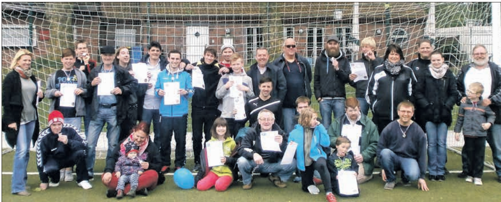
Alle Teilnehmer mit Medaillen und Urkunden beim Gruppenfoto nach dem tollen inklusiven Fußball-Turnier.

Lebenshilfe-Fußballturnier mit ehemaligen RWO-Spielern für Kicker mit und ohne Handicap