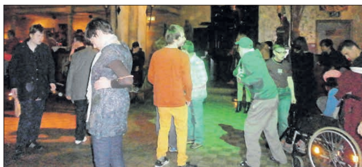
Viele Gäste der Lebenshilfe Oberhausen beim „Abfeiern“ im Adiamo.

Natürlich ist das „Adiamo“ barrierefrei und auch Rollstuhlfahrer schätzen die tolle Atmosphäre. Bei heißer Musik, kalten Getränken, Popcorn und einer Laser-