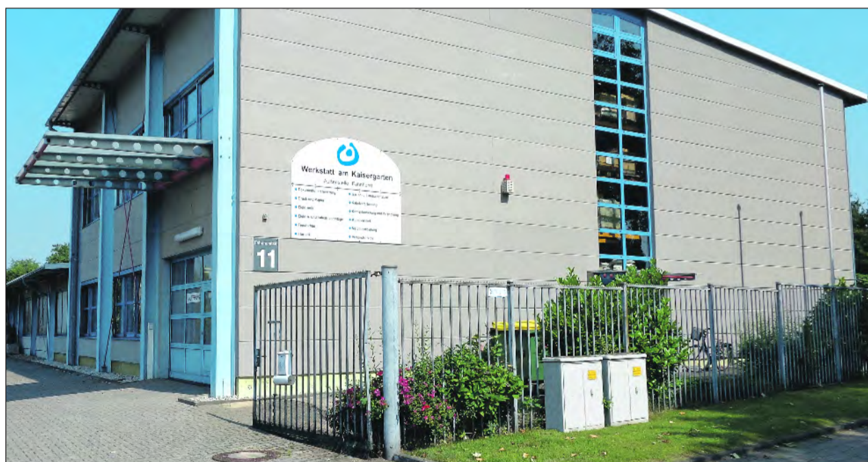
Unser Bild zeigt die neue Zweigstelle der Werkstatt am Kaisergarten an der Fahnhorststraße.

Ist zum Ende der beruflichen Rehabilitationsmaßnahme eine Eingliederung auf dem allgemeinen Arbeitsmarkt nicht realisierbar,