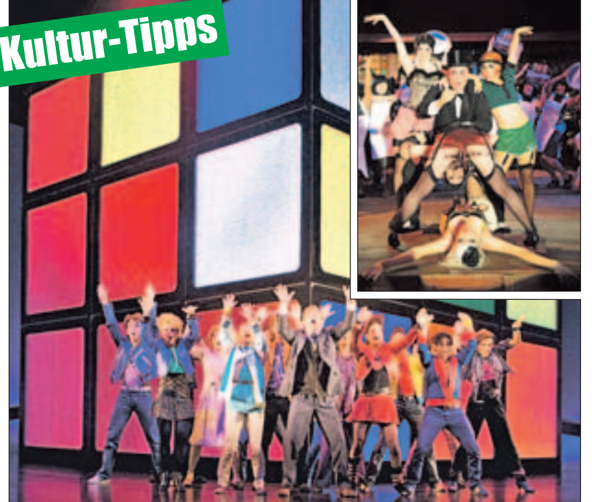
Reise in den Berliner Kit-Kat-Club der 20er-Jahre und in die Aufbruchstimmung der 80er.

Ich will Spaß! Das 80er Hit Musical mit den Hits der Neuen Deutschen Welle nimmt die Zuschauer im Colosseum-Theater in Essen mit auf eine Achterbahnfahrt der Gefühle. Eine Geschichte über Familie, Rebellion und wahre Liebe: aufregend und witzig, leise und nachdenklich, launisch und wild. Die Charaktere bewegt, was unsere Gesellschaft in den 80er-Jahren geprägt hat und heute noch beschäftigt: Friedensaktivismus, Generationskonflikte, veränderte Rollen von Mann und Frau. Die Suche nach der großen Liebe und dem eigenen Platz im Leben. Jeder will seine Träume verwirklichen, unabhängig sein – und Spaß haben. Tickets und Infos gibt es unter (0 18 05) 44 44 oder www.musicals.de