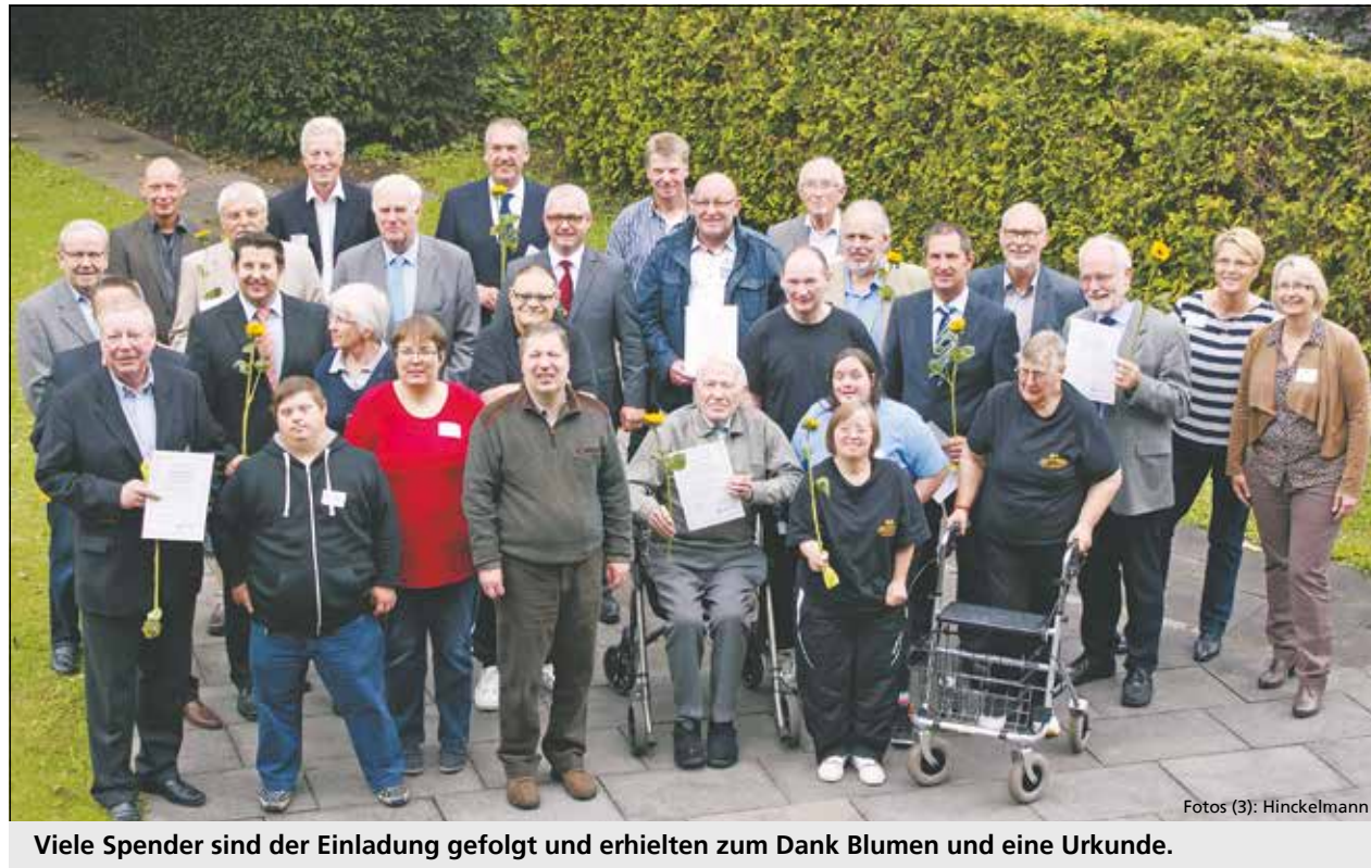
Viele Spender sind der Einladung gefolgt und erhielten zum Dank Blumen und eine Urkunde.

Es gibt ein Café, viele kreative Kurse für Erwachsene und Kinder, ein kleines Reisebüro, welches Ausflüge und Reisen für Menschen mit Behinderungen anbietet, Kochkurse, Ferienbetreuungen