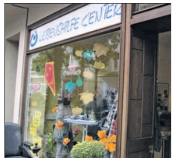
Lebenshilfe Center Hamm

Zurzeit gibt es neben dem Lebenshilfe Center in Hamm auch Center in Olpe, Netphen/Siegen, Gelsenkirchen, Gladbeck, Arnsberg und Duisburg. Weitere acht Center sind geplant. Infos im Internet unter www.lebenshilfe-nrw.de/einrichtungen suche