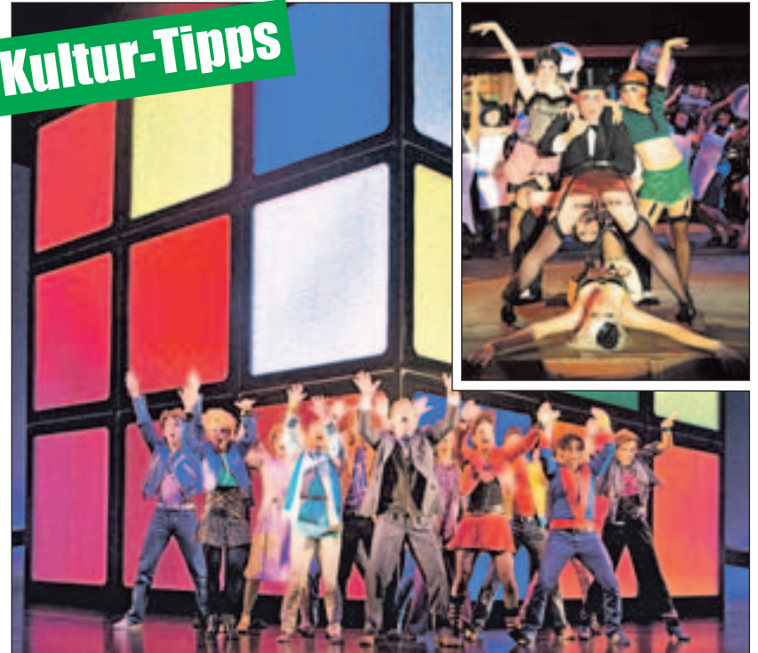
Reise in den Berliner Kit-Kat-Club der 20er-Jahre und in die Aufbruchstimmung der 80er.

Ich will Spaß! Das 80er Hit Musical mit den Hits der Neuen Deutschen Welle nimmt die Zuschauer im Colosseum-Theater in Essen mit auf eine Achterbahnfahrt der Gefühle. Eine Geschichte über Familie, Rebellion und wahre Liebe: aufregend und witzig, leise und nachdenklich, launisch und wild. Die Charaktere bewegt, was unsere Gesellschaft in den 80er-Jahren geprägt hat und heute noch beschäftigt: Friedensaktivismus, Generationskonflikte, veränderte Rollen von Mann und Frau. Die Suche nach der großen Liebe und dem eigenen Platz im Leben. Jeder will seine Träume verwirklichen, unabhängig sein – und Spaß haben. Tickets und Infos gibt es unter (0 18 05) 44 44 oder www.musicals.de