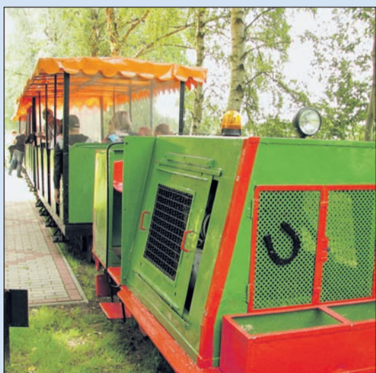
Mit der Moorbahn durch die Natur.

Sinne auf eine ganz faszinierende Art kennenlernen kann. Wagen Sie sich barfuß in den Fühlpfad mit unterschiedlichen Untergründen, gehen Sie über eine Wackelbrücke und trauen Sie sich auf das Kippbrett. Auf dem Weg durch den Sinnesgarten wird die Analemmatische Sonnenuhr mithilfe Ihrer ausgestreckten Hand und dem darauf erscheinenden Schatten die aktuelle Uhrzeit verraten. Auf der Verbindungsstraße Freistatt-Heimstatt befindet sich ein Planetenweg, der auf ca. fünf km maßstabsgetreu die Entfernungen der einzelnen Planeten zur Sonne darstellt. Ein schöner und erlebnisreicher Tag. Nochmals ein herzliches Dankeschön an Irene Jakob.