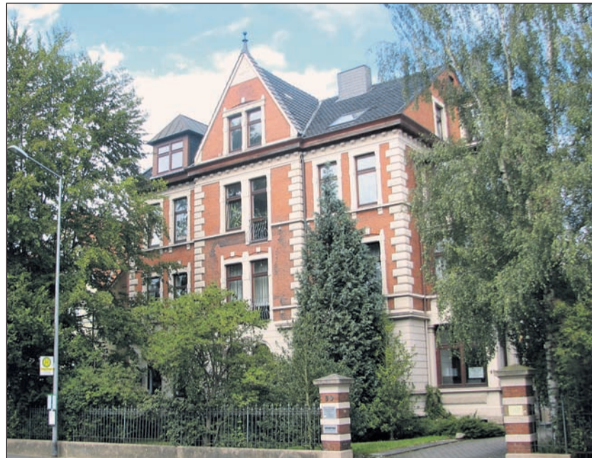
Das Haus der AA in der Königstraße 80.

Seit 1968 ist Alkoholismus als Krankheit durch das Bundessozialgericht anerkannt. Etwa 2,5 Millionen Menschen in Deutschland sind alkoholabhängig – weitere 2,7 Millionen betreiben Alkoholmissbrauch. Jährlich sterben etwa 40.000 Menschen an den Folgen von übermäßigem Alkoholkonsum. Infos unter www.alkomi.de