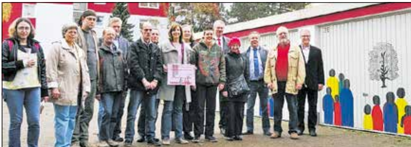
Künstler der Lebenshilfe, Mitarbeiter des Heimat- und Verkehrsvereins, der Interessengemeinschaft Schmachtendorf und der Immeo-Wohnen

Die Umriss der Motive wurden mit dem Overheadprojektor und teilweise „frei Hand“ auf die Garagentore übertragen und anschließend mit Lackfarbe ausgefüllt. Auch bei diesem Projekt bekam das Team der Werkstatt am Kaisergarten sehr oft Lob von vorbeikommenden Passanten und Anwohnern; Kindern gefielen besonders die bunten Personen. Die Arbeiten