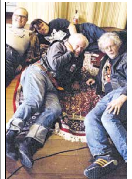
Die Punkband PKN

Drei der Mitglieder von PKN haben das Down-Syndrom, einer ist Autist. Zusammen sind sie eine waschechte Punkband. Texte über soziale Probleme passen, das Bier in der Hand haut hin und auch die Jeansknoten voller Band-Aufnäher sind stimmig.