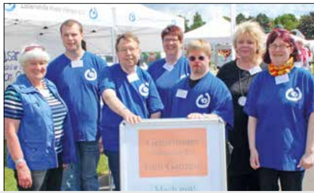
Zahlreiche Mitmach-Aktionen an den Ständen der Lebenshilfe Oberhausen (o. l./Karaoke), der Lebenshilfe Kreis Viersen (o. r./Malen) und der Lebenshilfe NRW (u. l./eine Form des Malens). Der Lebenshilfe Rat Kreis Viersen war auch dabei (u. r.).