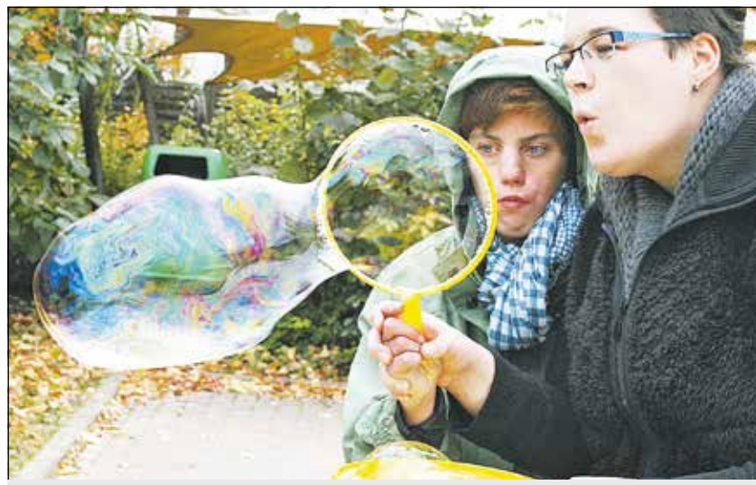
Faszination Seifenblase: Die Angebote des FeD bringen Abwechslung in den Alltag von Menschen mit Behinderungen und deren Angehörigen.