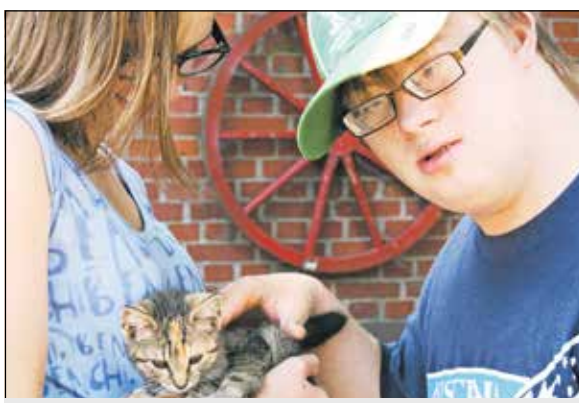
Der integrative Erlebnis-Bauernhof Steckenpferd in Bünde-Muckum schenkt neue Erfahrungen und Einblicke.

„Der Familienentlastende Dienst bietet Hilfen im Alltag und macht auch Auszeiten wie Urlaube oder