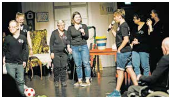
Der Besuch der Enkel startete bei Kaffee und Kuchen.

Ein Jahr hatte man jeden Mittwoch in den Räumen des Gymnasiums geprobt. Das Miteinander begann damit, dass die Schüler die Menschen mit Behinderung in der