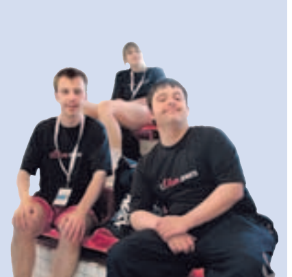
Nach getaner Arbeit ein verdientes Pauschen.