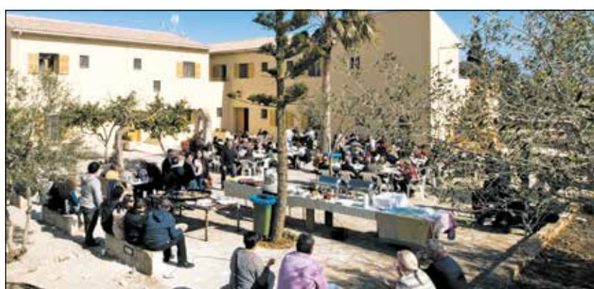
Die neue Finca auf Mallorca mit toller Aussicht

Neue Finca der Lebenshilfe NRW lässt Herzen höher schlagen: Im April 2014 hat die barrierefreie Anlage mit einem 15000 qm großen Grundstück in direkter Nähe zu Sa Coma und Cala Millor eröffnet. Zwei unterschiedlich große Häuser mit Ein- und Zweibettzimmern bieten insgesamt 33 Schlafplätze. Die dazugehörigen Pools der Häuser und der gemeinsam nutzbare Dorfplatz runden das einzigartige Lebensgefühl ab.