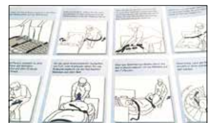
Piktogramme machen die Vorgehensweise für alle verständlich.

Im Falle eines Brandes muss es zu meist sehr schnell gehen. In einer Wohnstätte, in der viele Menschen miteinander leben, fordert eine solche Situation schnelles Handeln. Daher hat das Haus Franz Goebbels in Volkhoven/Weiler für alle Bewohner, die bettlägerig oder schlecht zu Fuß sind, Evakuierungstücher angeschafft. Diese werden unter die jeweiligen Matratzen gelegt, um den nachts darauf liegenden Bewohner im Notfall anschnallen zu können. So kann der Bewohner leicht mit der Matratze über Fußböden, Fliesen, Teppichböden und abführende Treppen aus dem Gefahrenbereich gezogen werden. An groß dimensionierten Gurtgriffen jeweils am Kopf- oder Fußende und zusätzlich in der Mitte der beiden Längsseiten wird die Matratze aus dem Bett gezogen und über den Fußboden in Sicherheit gebracht. Dadurch entsteht für den liegenden Bewohner eine sichere, schützende U-Form der Matratze. Das Evakuierungstuch kann auch für eine Fensterrettung verwendet werden.