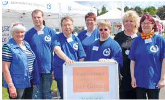
Zahlreiche Mitmach-Aktionen an den Ständen der Lebenshilfe Oberhausen (o. l./Karaoke), der Lebenshilfe Kreis Viersen (o. r./Malen) und der Lebenshilfe NRW (u. l./eine Form des Malens). Der Lebenshilfe Rat Kreis Viersen war auch dabei (u. r.).