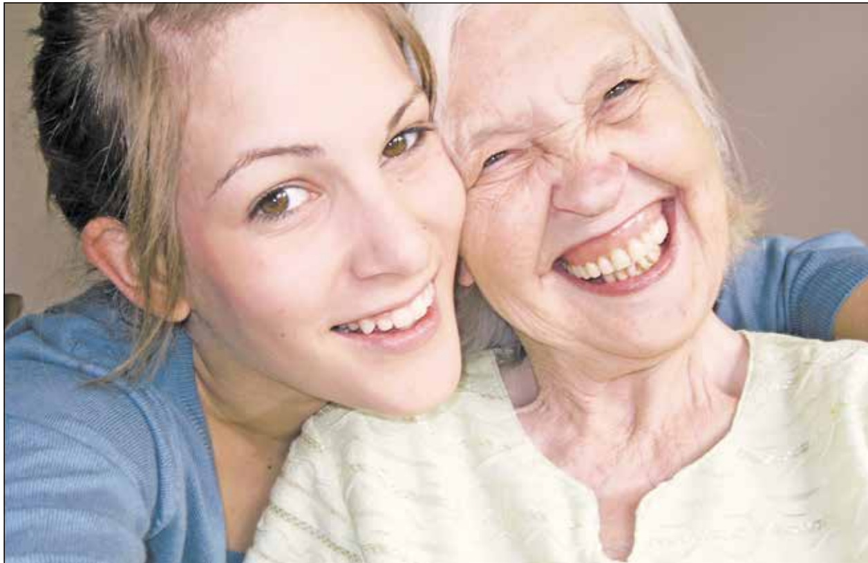
Die Lebenshilfe NRW bietet ehrenamtliches Engagement für jedes Alter.

Was Sie davon haben? Neben der Möglichkeit Verantwortung zu übernehmen, bietet Ihnen das Ehrenamt die Chance, Erfahrungen zu sammeln