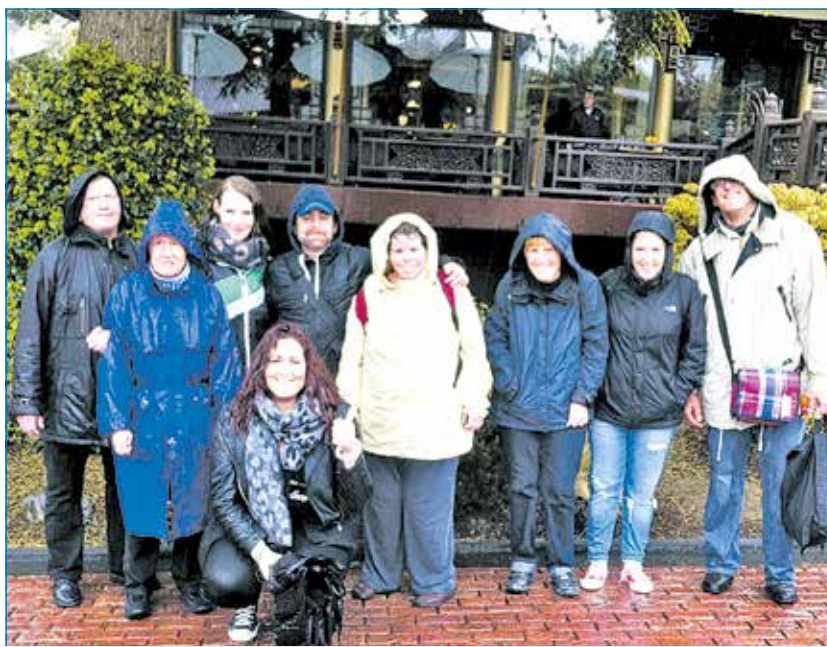
Trotz Regen hatten die geladenen Besucher viel Spaß im Phantasialand.

Der Freizeitpark Phantasialand in Brühl bei Köln wurde am 30. April 1967 auf dem Gelände des ehemaligen Braunkohle-Tagebaugesbietes in Ville gegründet. Zunächst stellte er einen Märchenpark aus Puppen