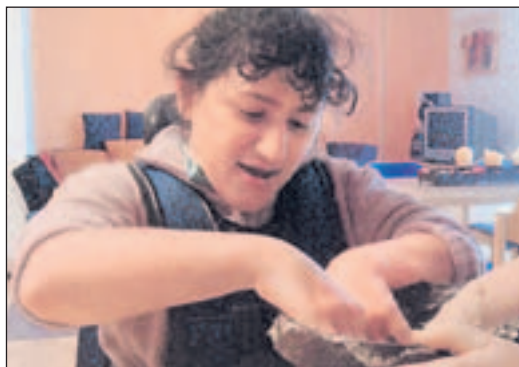
Spaß beim Karneval, Tradition: Backen von Kölner Mutzemandeln.

Der Nubbel ist eine Strohuppe die aussieht wie eine Art Vogelscheuche. Viele Wirte in Köln hängen sich den Nubbel zu Karnevalsbeginn über den Eingang zu ihrer Kneipe. Von dort oben wacht er und sieht alles bunte Treiben in den Karnevalstagen. Dann, in der Nacht von Dienstag auf Aschermittwoch punkt 0:00 Uhr, wird der Nubbel abgenommen und man bildet vor der Kneipe einen Kreis um ihn. Eine Anklageschrift wird vorgetragen, meistens in Mundart und oft auch gereimt. Der Ankläger ist ein Karnevalsjeck, der sich als Geistlicher verkleidet hat. Zunächst verteidigt die Menge den Nubbel, am Ende ist sie von seiner Schuld überzeugt und fordert Rache. Die Anklage gipfelt dann beispielsweise in rhetorischen Fragen wie: „Wer