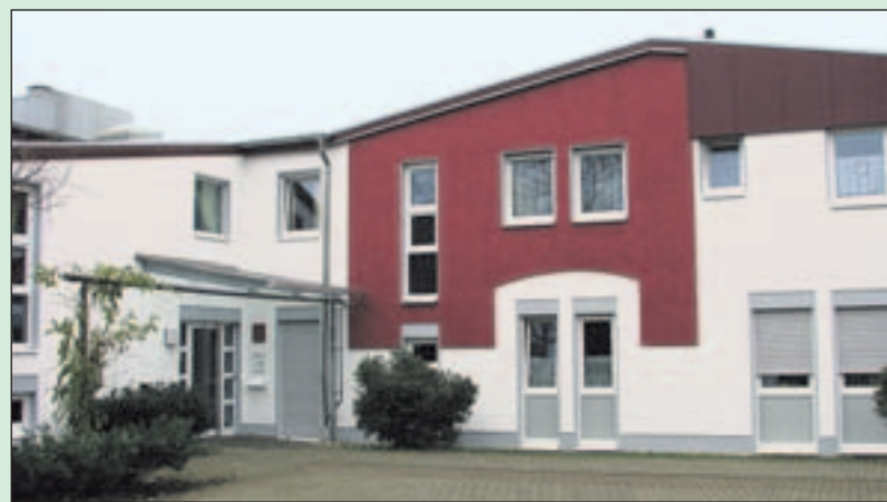
Haus der Lebenshilfe in neuem Glanz.

Im neuen Glanz ist die Wohnstätte der Lebenshilfe nicht nur ein Blickfang für den Grasnelkenweg, sondern für das ganze Viertel!