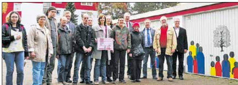
Künstler der Lebenshilfe, Mitarbeiter des Heimat- und Verkehrsvereins, der Interessengemeinschaft Schmachtendorf und der Immeo-Wohnen

Die Umriss der Motive wurden mit dem Overheadprojektor und teilweise „frei Hand“ auf die Garagentore übertragen und anschließend mit Lackfarbe ausgefüllt. Auch bei diesem Projekt bekam das Team der Werkstatt am Kaisergarten sehr oft Lob von vorbeikommenden Passanten und Anwohnern; Kindern gefielen besonders die bunten Personen. Die Arbeiten