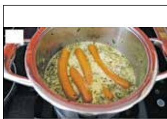
Würstchen in Suppe geben. 5 Minuten weiter köcheln.

Auszüge des Rezeptes in Leichter Sprache