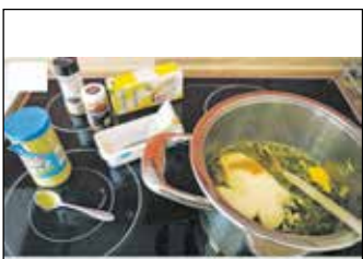
Schmelzkäse und 1 TL Senf hineingeben. Mit Salz, Pfeffer, Muskat würzen. Verrühren.

Aus: Kochwerkstatt des Familienunterstützenden Dienstes der Lebenshilfe Heinsberg in Leichter Sprache (Seite 4)