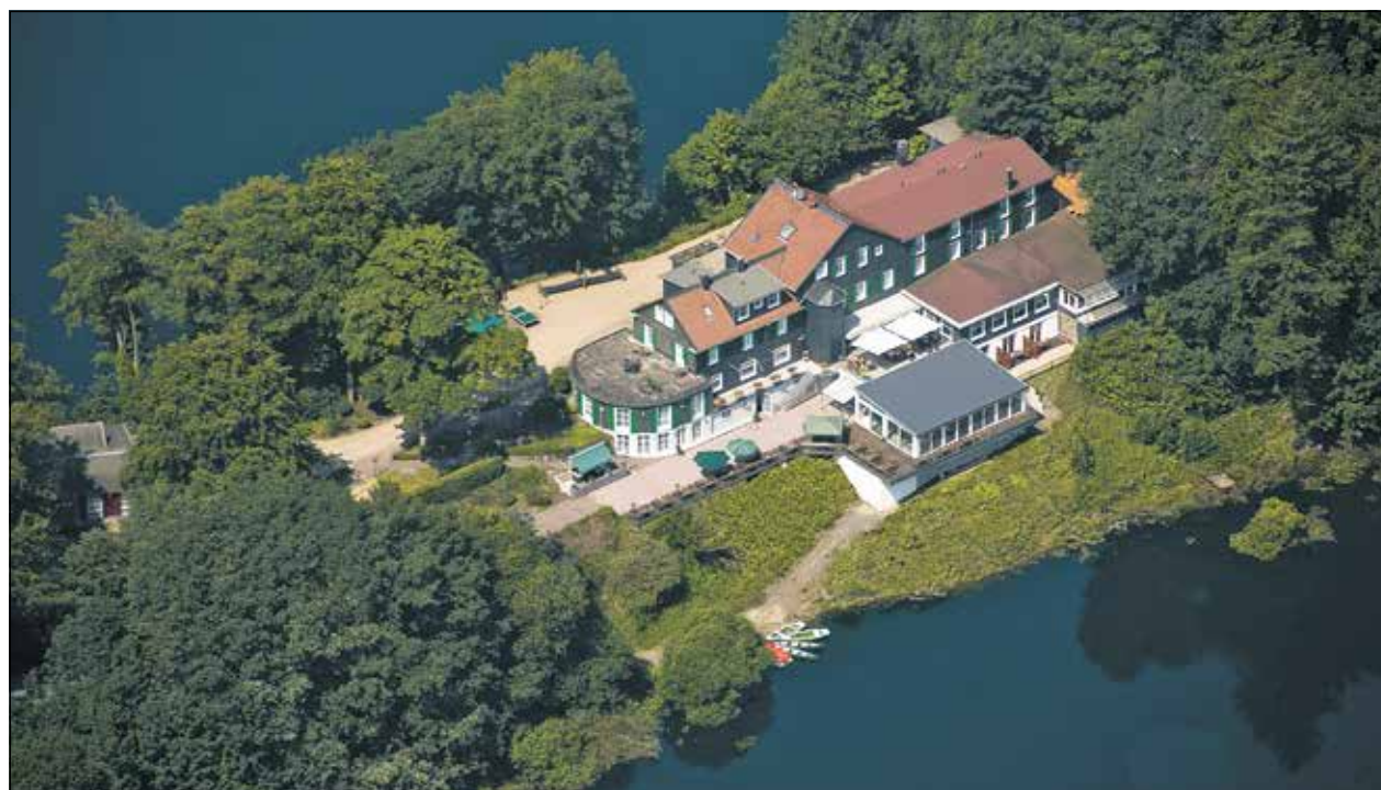
Haus Hammerstein im Bergischen Land: Tagen, Fortbilden und Hochzeit feiern in idyllischer Natur.

In Haus Hammerstein finden alle Kurse und Seminare des zertifizierten Aus- und Fortbildungsbereiches der Lebenshilfe NRW statt. Dazu gehören neben Kursreihen mit qualifizierten Abschlüssen für Fach- und Führungskräfte, ein großes Spektrum an Themen aus den Bereichen Wohnen, Arbeit, Kindertageseinrichtungen und Schulen, Führung und Management sowie arbeitsfeldübergreifende Angebote. Pro Jahr besuchen ca. 1500 bis 2 000 Teilnehmer die ein- bis mehrtägigen Fortbildungsangebote in Haus Hammerstein, die sich an haupt- und ehrenamtlich interessierte Personen wenden und nicht nur Mitarbeitern aus Lebenshilfeeinrichtungen offenstehen.