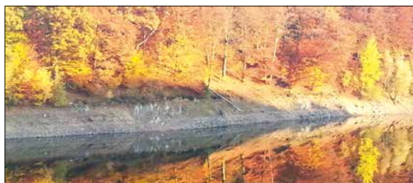
Im Herbst spiegelt sich der Wald im See in seinen schönsten Farben.

Und so genießen Sie auch heute als unsere immer willkommenen Gäste dieses geschichtsträchtige Haus. Ob bei einem erholsamen