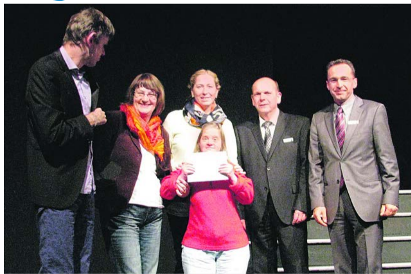
Kleine Geste bewirkte große Freude.