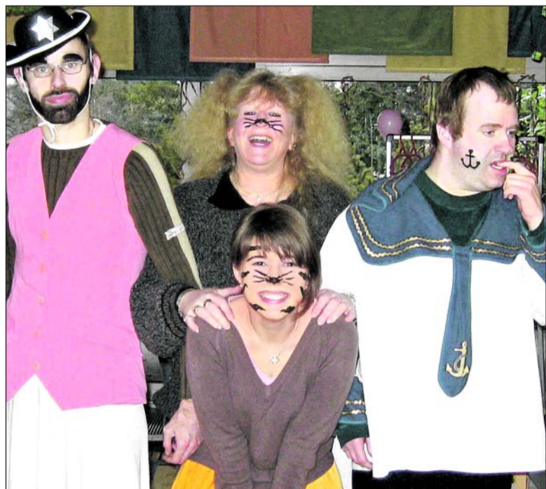
Wir grinsen um die Wette.

Dies wird aber gerne in Kauf genommen, um die Chance zu nutzen, aus dem Alltag zu entfliehen. Kreativ werden die Jecken, indem sie durch ihre Kostüme in eine andere Rolle schlüpfen. Das Ausgefallene, das anders sein steht im Mittelpunkt und wird anerkennend honoriert. Für die