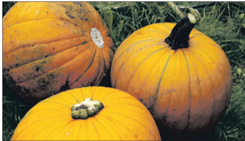
Kürbis und Kumpanen – frisch geerntet und ungeschminkt.

Wussten Sie, liebe Leser, dass Kürbisse zu den größten Beeren der Welt zählen? Denn Beerenfrüchte sind jene, die in ihrem Fruchtfleisch zahlreiche Samen beherbergen, so wie z. B. Gurken und Melonen, die auch zu den Kürbisgewächsen gehören. Ab September leuchtet es gelborange in den Gemüseriegeln, auf dem Wochenmarkt oder im Bioladen – es ist (Speise-)Kürbiszeit.