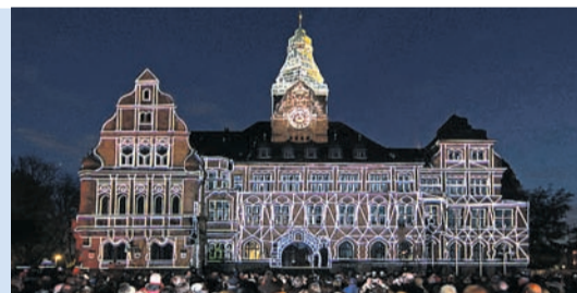
Recklinghausen leuchtete 2010.

Zum Schluss ein toller Tipp für unsere Kleinen. Das Kindertheater Kithea bietet auch in diesem Jahr wieder ein volles Programm ganz und gar nur für Kinder. Einmal im Monat, von Oktober bis April, werden bekannte Geschichten wie vom