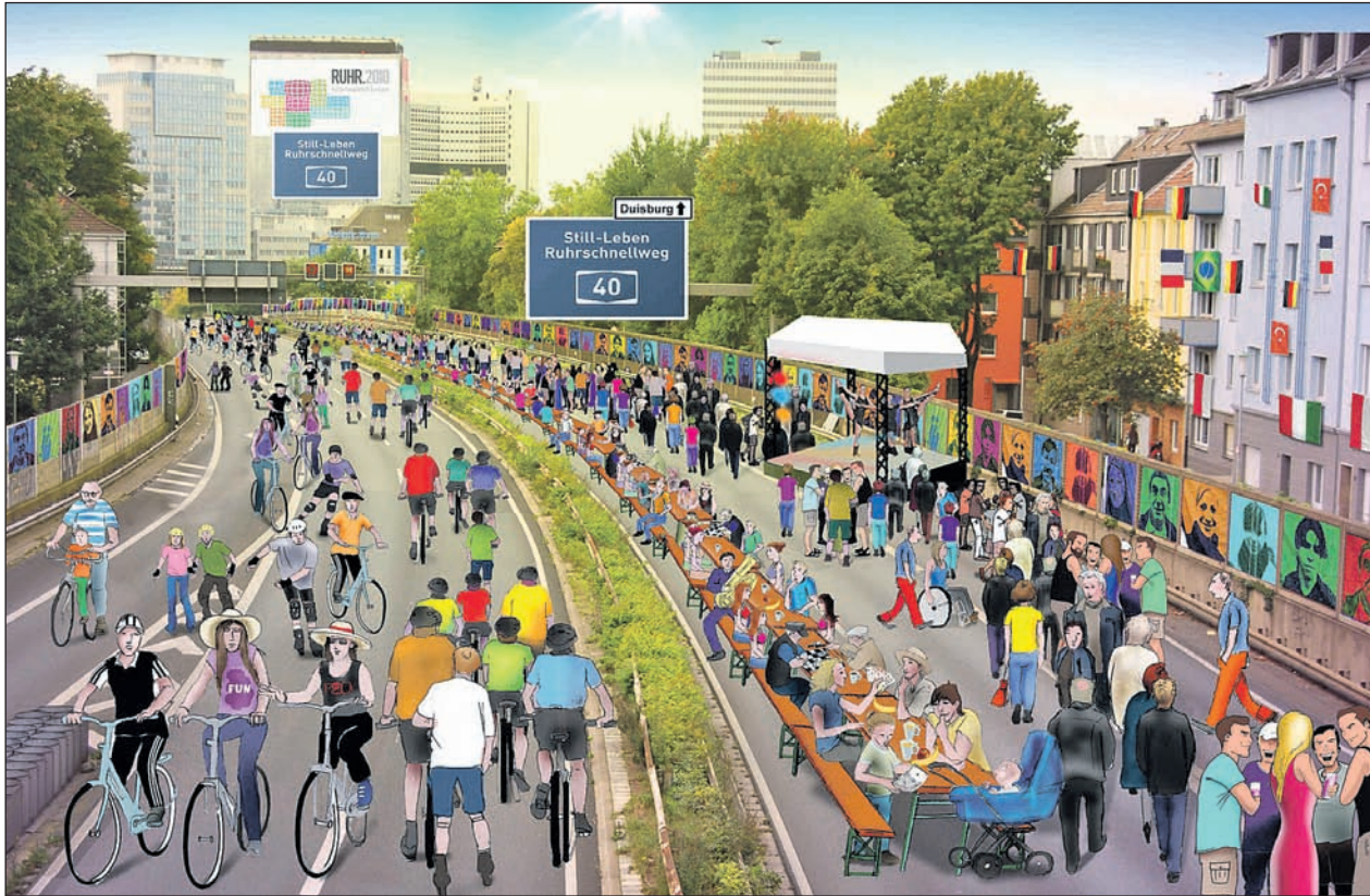
Ruhr.2010-Projekt „Still-Leben Ruhrschnellweg“: So könnte es aussehen!

Zum Glück gibt es im Hertener Glashaus einen sog. i-Punkt Kultur, dort findet man Informationen zur Kulturhauptstadt, zu Kultur- und Freizeitangeboten und Sehenswürdigkeiten in Herten. Ebenso kann man sich Auskünfte zum Kulturbegleitedienst einholen. Dieser gibt älteren und nicht mehr so mobilen Menschen die Möglichkeit, in Begleitung an kulturellen Veranstaltungen teilzunehmen. Erwähnenswerte Projekte, an denen sich Herten beteiligt,