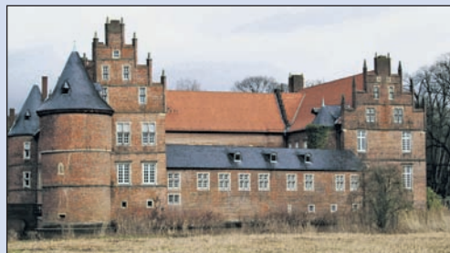
Das Hertener Wasserschloss, hier und im Schlosspark wird der Kunstmarkt stattfinden.

Auch dieses Jahr werden die Pforten des Kunstmarkts von 11 bis 19 Uhr für Kunst- und Kulturinter-