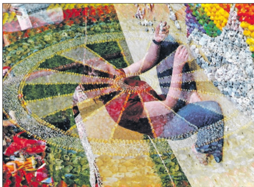
Die „Kulturelle Landpartie“ in Mützingen.

Ein kleines Paradies für alle, die Erholung und Inspiration suchen