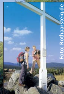
Wanderer auf dem Rothaarsteig.

nus ebenso wie an den steilen Talhängen des Rheintals. Beliebter Einstieg bei Wanderern: im Rheingau, denn hier verläuft der Weg nicht durch Schluchten, sondern über sanfte Hügel und Rebhänge mit tollem Panoramablick ins Rheintal.