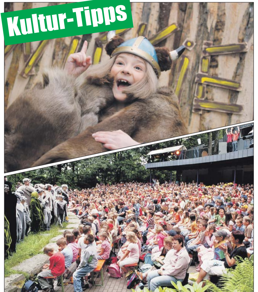
Abwechslungsreiches Programm wird auf der Waldbühne Heessen in Hamm und auf der Freilichtbühne Schloß Neuhaus geboten.