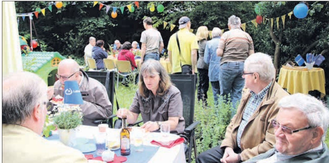
Gelungenes Jubiläum zu fünf Jahren Treffpunkt Lebenshilfe.