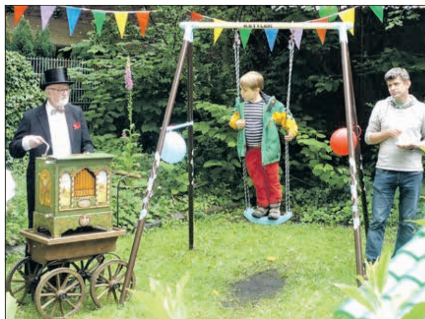
Ein Fest für alle Sinne