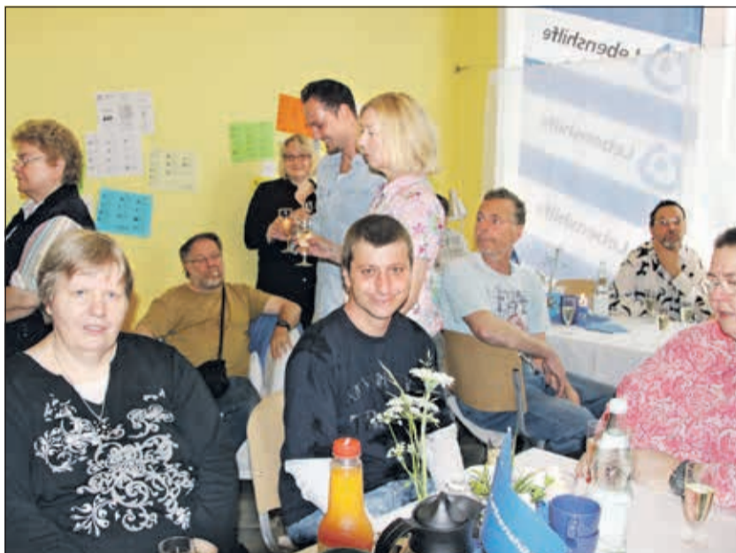
Seit fünf Jahren sind wir dabei!

Leben, Lust auf Neues und Freude gefüllt sein.