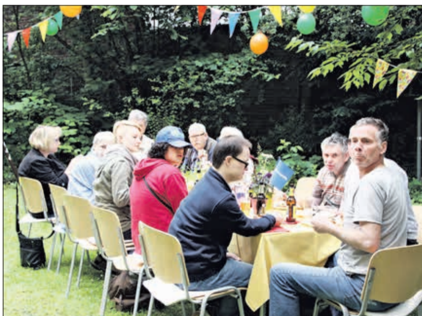
Eine schöne Feier mit vielen Gästen im sommerlichen Garten