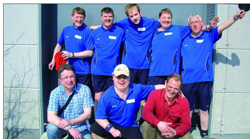
Bei dem 12. Special Olympics Tischtennis-Turnier NRW in Essen war das Tischtennis-Team der Lebenshilfe Hamm wieder erfolgreich und konnte zahlreiche Gold-, Silber- und Bronze-Medaillen mit nach Hause bringen.