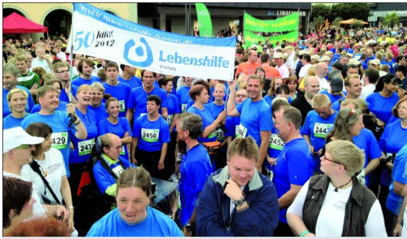
Das Team der Lebenshilfe.

Zahlreiche Teilnehmer beim AOK-Lauf und bei der Oldtimer-Rallye