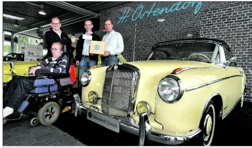
Die Auslosung fand am 20. Juli 2012 statt.

A n zwei Ereignissen war die Lebenshilfe auch im vergangenen Jahr wieder dabei.