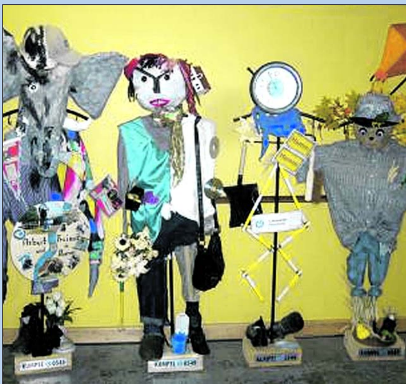
Kreativ gestaltete Zechenhaken

So verwandelte sich ein Zechen-Haken in das Symbol der Stadt Hamm, den „Elefanten“ – der hier zum einen die Arbeitswelt sowie mögliche Freizeitaktivitäten in der Stadt Hamm darstellen soll. Weitere Zechen-Haken stellen eine „Madonna in grün“ – eine „Vogelscheuche“ sowie einen „Arbeitskumpel“