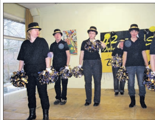
Lebenshilfe Hamm ganz jeck im Karneval unterwegs.