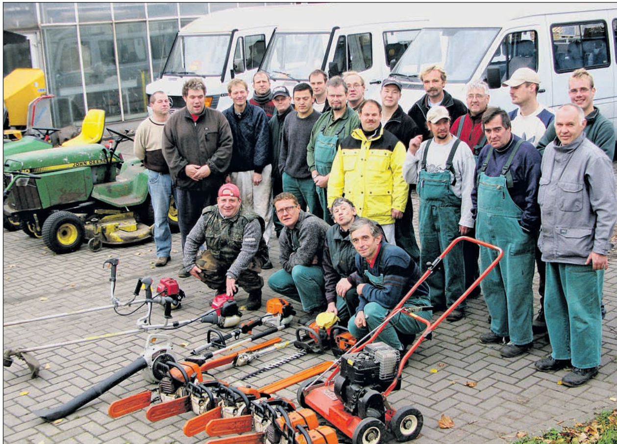
Das Team der GALA-Gruppe.

Auch die Weiterqualifikation spielt bei den Gruppenleitern eine große Rolle. So erfolgte in den letzten Jahren eine Spezialisierung auf Baumschnittarbeiten und es wurden hierzu alle Sicherheits-scheine und Arbeitsberechtigungen erworben, sodass auch schwierigste Baumfällarbeiten unter Einsatz der entsprechenden Gerä-