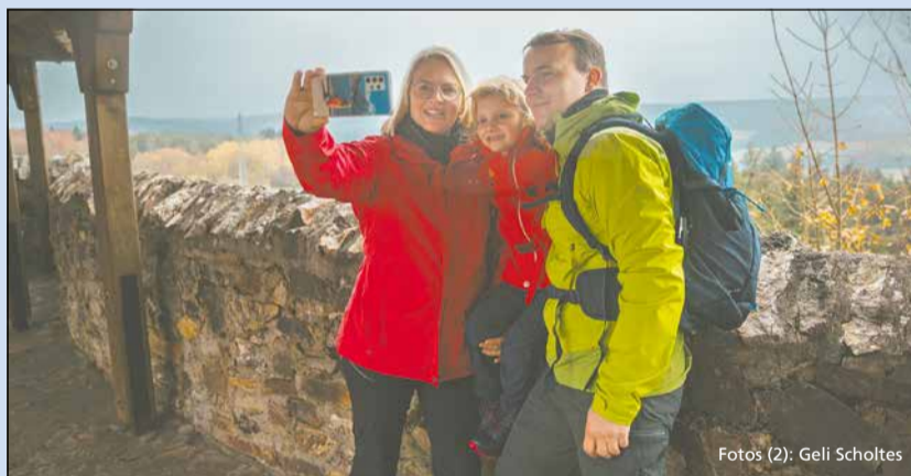
Hingucker: die Nationalparkregion Hunsrück-Hochwald

Überall säumt Moos den Wegesrand, schmale Pfade führen über Wurzeln und Felsblöcke, vorbei an glucksenden Waldbächen hinauf auf die Berge. Frisch und würzig ist die Luft der Wäl-