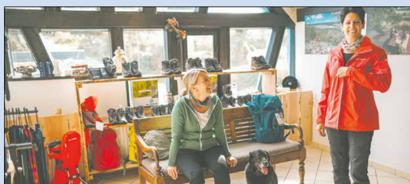
Testcenter für Wanderer: Moderne Ausrüstung kostenfrei ausleihen.

Die Teilnehmerin/der Teilnehmer kann seine erklärte Einwilligung jederzeit widerrufen. Der Widerruf ist schriftlich an die im Impressum angegebenen Kontaktdaten des Veranstalters zu richten. Nach Widerruf der Einwilligung werden die erhobenen und gespeicherten personenbezogenen Daten des Teilnehmers umgehend gelöscht. Fragen oder Beanstandungen im Zusammenhang mit dem Gewinnspiel sind an den Betreiber zu richten. Der Rechtsweg ist im Hinblick auf die Ziehung der Gewinnerin/des Gewinners ausgeschlossen.