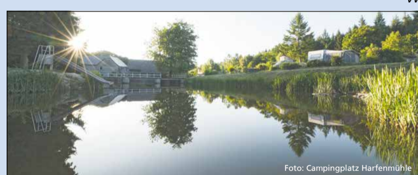
Idylle pur am See auf dem Campingplatz Harfenmühle

Wanderer können in der Region ab sofort einen einzigartigen Service in Anspruch nehmen: Der Campingplatz Harfenmühle beherbergt das neue Best of Wandern-Testcenter, in dem alle Gäste, die in der Region Urlaub machen, moderne und funktionale Wanderausrüstung für