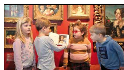
Die Kinder freuen sich über das neue Buch. Foto: Thomas

waschen“ mit Arbeiten aus dem Museum Begas-Haus in Heinsberg abgebildet werden.