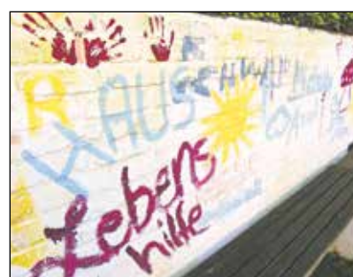
Pure Lebensfreude Foto: Nüchel

fen, in dem sich Bewohner, aber auch Gäste wohl fühlen können. Das neue Fußballfeld, das auch für Rollstuhlfahrer geeignet ist und somit die Beweglichkeit im Garten erleichtert, ist besonders für die Kinder und Jugendlichen der Höhepunkt des Projektes. Aber auch die neuen Bepflanzungen oder die selbst gestaltete Steinmauer verleihen dem Garten seine Individualität. Es ist ein Garten der Begegnung geworden, in dem Menschen mit und ohne Behinderung Zeit und Spaß miteinander haben. Danke an alle für das Engagement zur Umsetzung des Projektes. Nüchel/Neumann