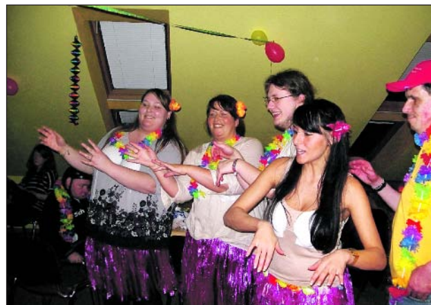
Gemeinsam ausgelassen feiern.