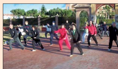
Schüler des Tai Chi Forums beim Ferienkurs an der Torrox Costa in Andalusien/Spainien.

Langsam geht eine Bewegung in die nächste über. Konzentriert werden die Übungen beim Tai-Chi-Chuan, einer jahrhundertalten, chinesischen Bewegungstechnik mit meditativer Ausrichtung, ausgeführt. Im Tai-Chi-Chuan als Entspannungstraining kommt es auf Weichheit und Geschmeidigkeit an. Die Muskulatur soll im Laufe der Zeit entspannt und die Gelen-