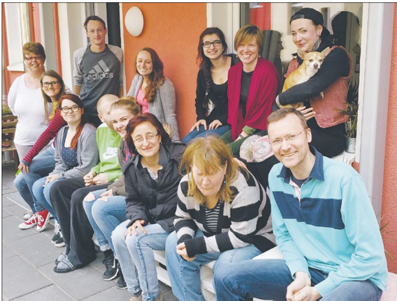
Gemeinsam aktiv: Bewohner und Mitarbeiter der inklusiven Hausgemeinschaft in Dortmund.

Inklusive Hausgemeinschaft: Studenten und Menschen mit Behinderung wohnen gemeinsam und erfahren viel über ihr Leben