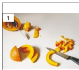
Kürbis halbieren, Kerne und Fäden entfernen, in Stücke schneiden.

Aus: Kochwerkstatt des Familienunterstützenden Dienstes der Lebenshilfe Heinsberg in leichter Sprache (Seite 4)