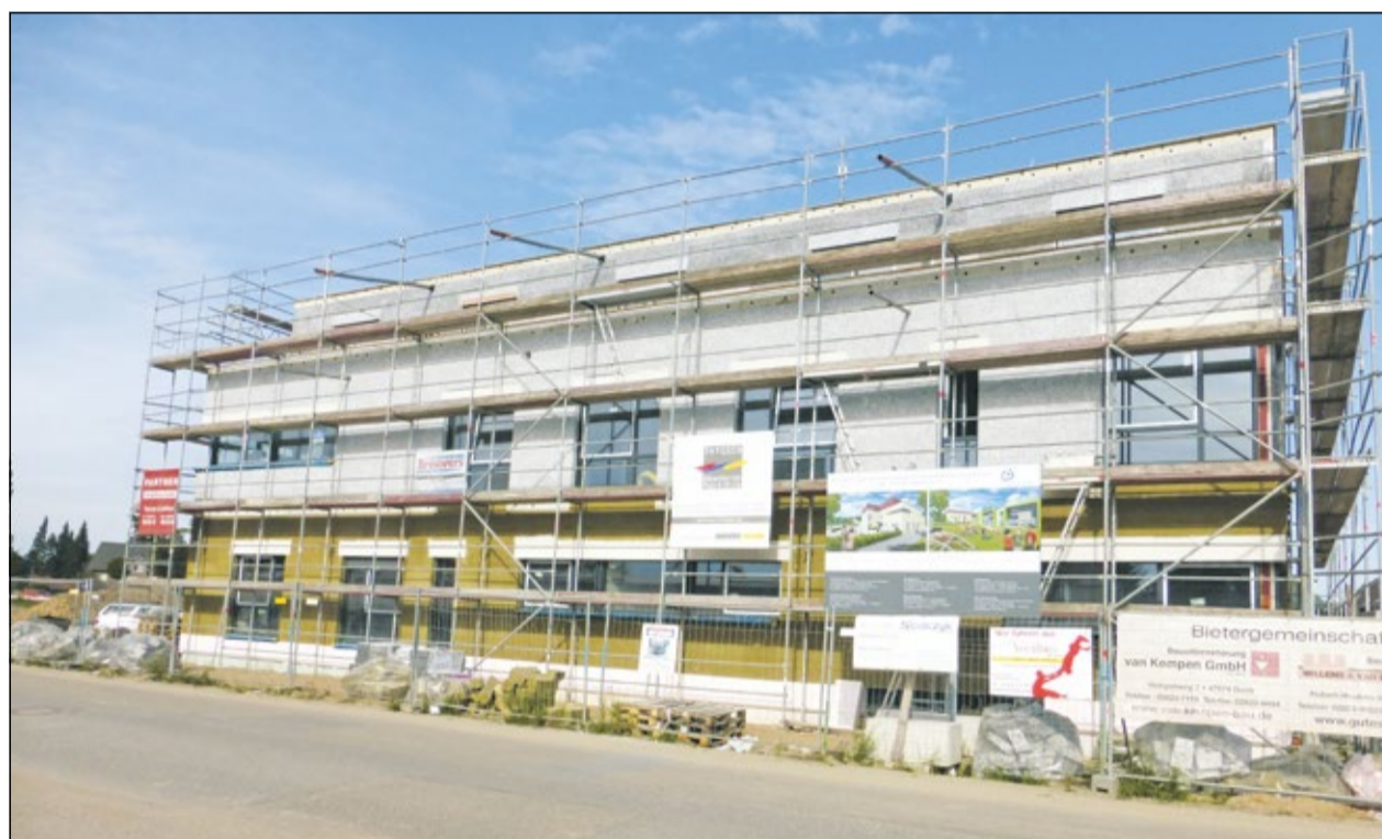
Anfang September zeigte sich noch diese Baustelle. Inzwischen können Sie aber das Gesicht und Stil des Gebäudes erkennen.

Gebäude ist noch eingerüstet, da die Fassade noch montiert werden muss. Auch im Gebäude ist noch reichlich Arbeit – aber es sind auch noch drei Monate Bauzeit! Bei dem Tempo, das die heimische Bauwirtschaft vorlegen kann, sind wir zuversichtlich, dass die Schlüssel