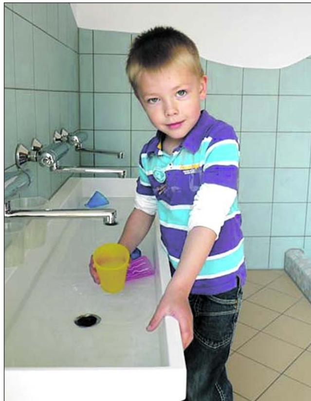
Sven hat die Ärmel hochgekrempelt, „die Becher müssen gefüllt werden“ (links). Auch in der Wichtelwelt steht den Kleinen ein „Super-Matschraum“ für die feuchten Arbeiten zur Verfügung (rechts oben). Der neue Sanitärbereich der Kita Arche Noah in Issum, freundlich und kindgerecht.

Die Bagger und Handwerker waren aber nicht nur in Straelen und Issum aktiv. Auch in Kerken-Stenden, in unserer „Kita Klatschmohn“, in Weeze im Familienzentrum „Wee-