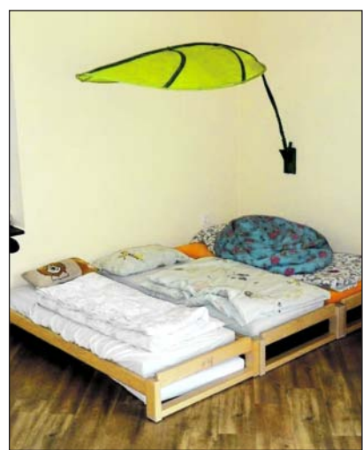
Und nach getaner Arbeit wird über Mittag im Ruheraum geschlafen, zumindest könnte man da schlafen.