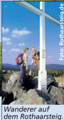
Wanderer auf dem Rothaarsteig.

nus ebenso wie an den steilen Talhängen des Rheintals. Beliebter Einstieg bei Wanderern: im Rheingau, denn hier verläuft der Weg nicht durch Schluchten, sondern über sanfte Hügel und Rebhänge mit tollem Panoramablick ins Rheintal.