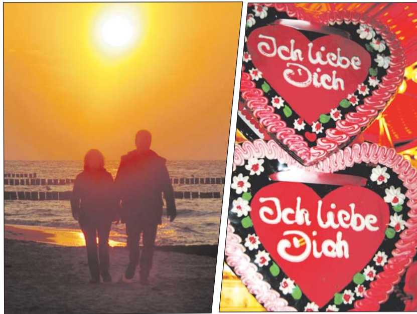
Wenn die Herzen im Frühling höher schlagen.

Eine Flasche Wein mit persönlichem Etikett: aus einem Spitzenwein eine eigene Marke kreieren, beispielsweise mit einem Foto von